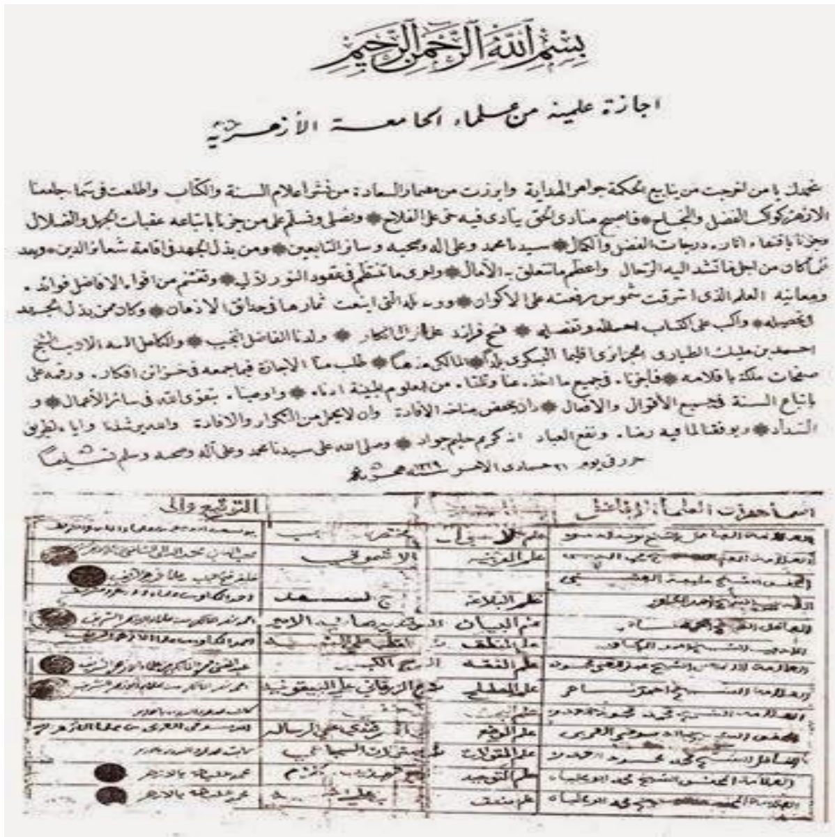
صورة للاجازة العلمية التي تحصل عليها من علماء جامعة الأزهر