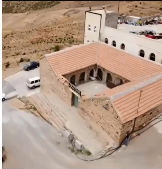
زواية عين العقاقين