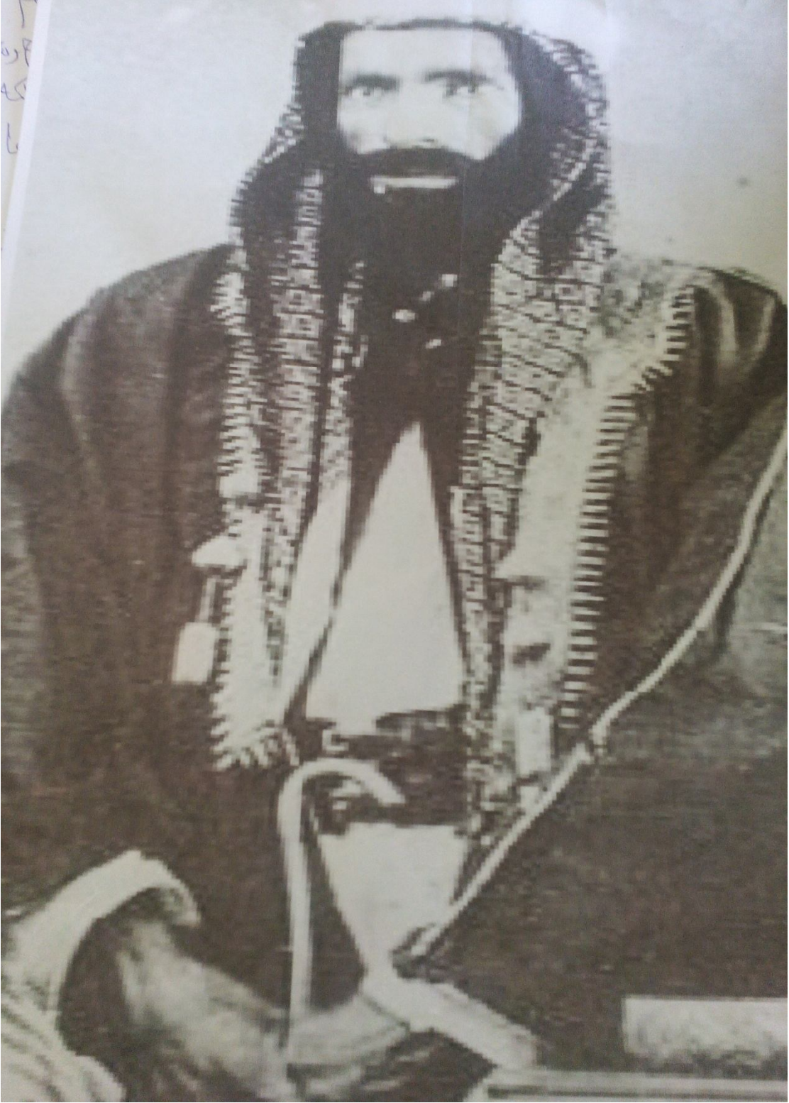
منقول من أسامة سليمان الفليح "تويتر"