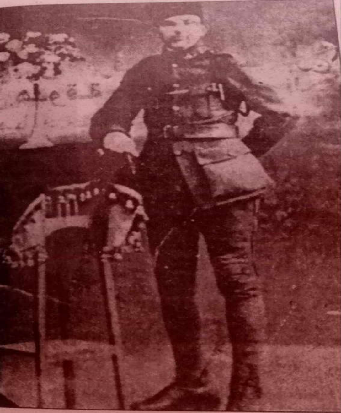
الملحق رقم (02):الأحمدي في الخدمة العسكرية