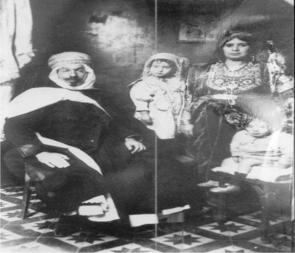
صورة نادرة لعائلة مالك بن نبي