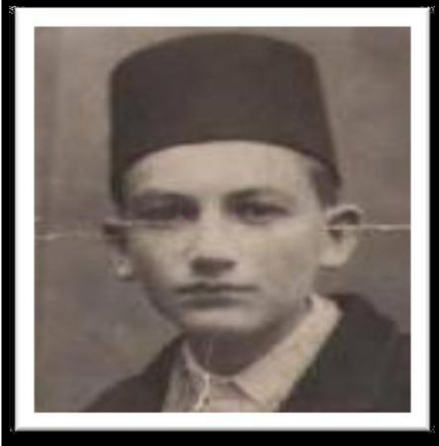
مالك بن نبي -الطفل-

الجمهورية الجزائرية الديمقراطية الشعبية وزارة التعليم العالي والبحث العلمي جامعة محمد بوضياف - المسيلة كلية العلوم الإنسانية والاجتماعية 2021 /2020