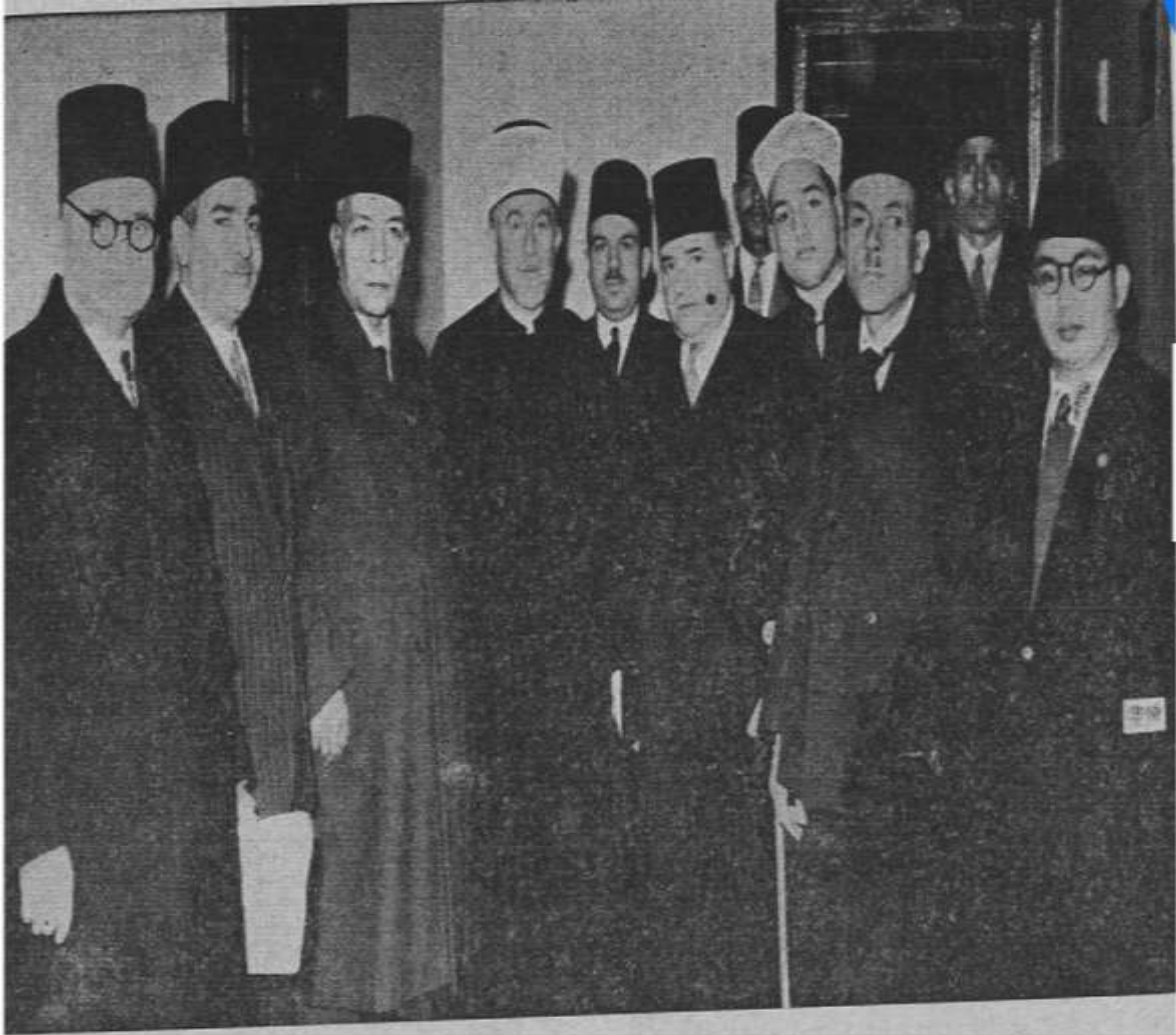
في حفلة تأيين الأمير شكيب أرسلان بدار الأوبرا الملكية يوم 6 فبراير سنة ١٩٤٧ وفد ظهر في الوسط سماحة المفتي الأكبر السيد الأمين الحسيني وإلى يمينه محمد علي علوبة باشا الأستاذ علي محمود طه فنجيب برادة بك وإلى يساره السيد محمد بن عبود رئيس وفد تطوان

الملحق رقم (09): حفلة تأيين الأمير شكيب بدار الأوبرا الملكية يوم 6 فبراير سنة 1947 وفد ظهر في الوسط سماحة المفتي الأكبر السيد الأمين الحسيني وإلى يمينه محمد علي علوبة باشا الأستاذ علي محمود طه فنجيب برادة بك وإلى يساره السيد محمد بن عبود رئيس وفد تطوان