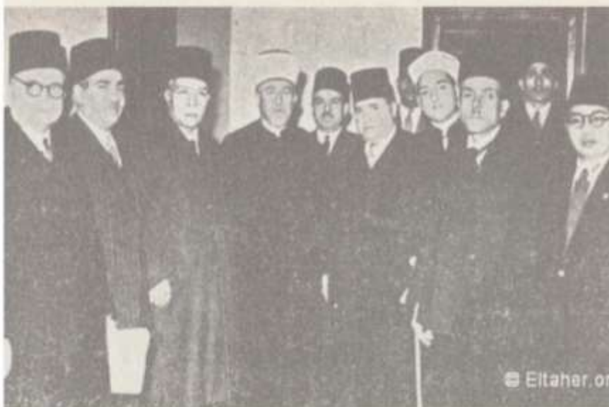
حفل إحياء ذكرى الأمير شكيب أرسلان في دار الأوبرا الملكية بالقاهرة 1947م ومحمد علي الطاهر الثاني من اليمين المصدر: Eлтаher.com

قاسم بن خلف الرويس، سوانح أفكار أمير البيان شكيب أرسلان مع موجز من سيرته، المرجع السابق،