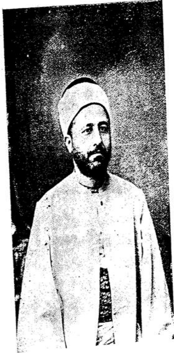
الفقيه السيد محمد رشيد رضا بعد هجرته الى مصر سنة ١٣٢٧

الملحق رقم (20): الفقيه السيد محمد رشيد رضا بعد هجرته من مصر