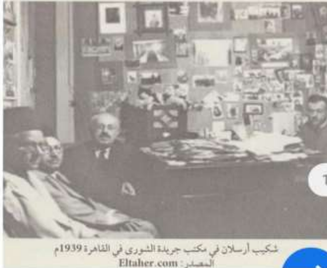
شكيب أرسلان في مكتب جريدة الشورى في القاهرة 1939م

قاسم بن خلف الرويس، سوانح أفكار أمير البيان شكيب أرسلان مع موجز من سيرته، المرجع السابق، ص 129.