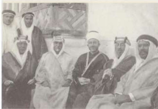
وفد الصلح بين السعودية واليمن 1934م/1353 هـ وشكيب أرسلان الثاني من اليمن

الملحق رقم (02): وفد الصلح بين السعودية واليمن 1934 م / 1353 هـ وشكيب أرسلان الثاني من اليمن شكيب أرسلان في مكتب جريدة شوري في القاهرة 1939م