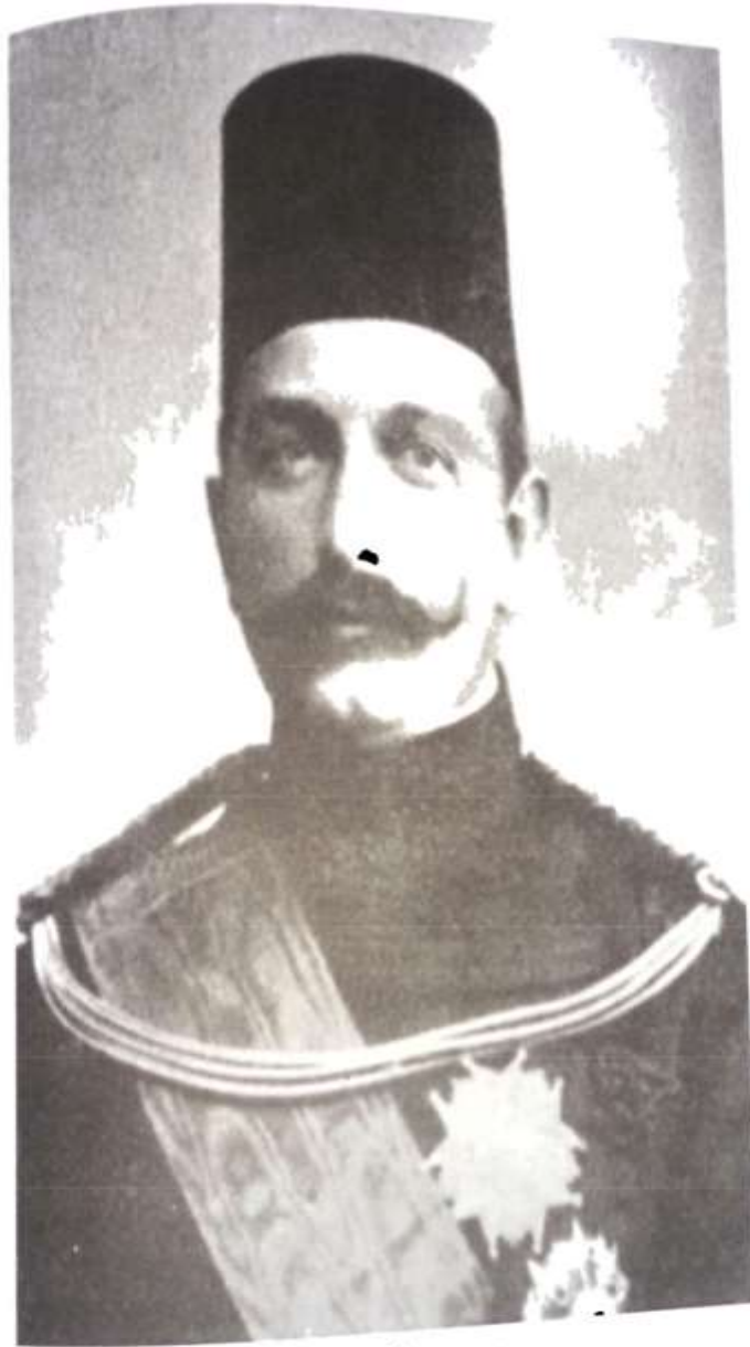
الخديوي عباس حلمي

أمير شكيب أرسلان، خلاصة المرحوم السيد أحمد شريف سنوسي، المصدر السابق، ص 79.