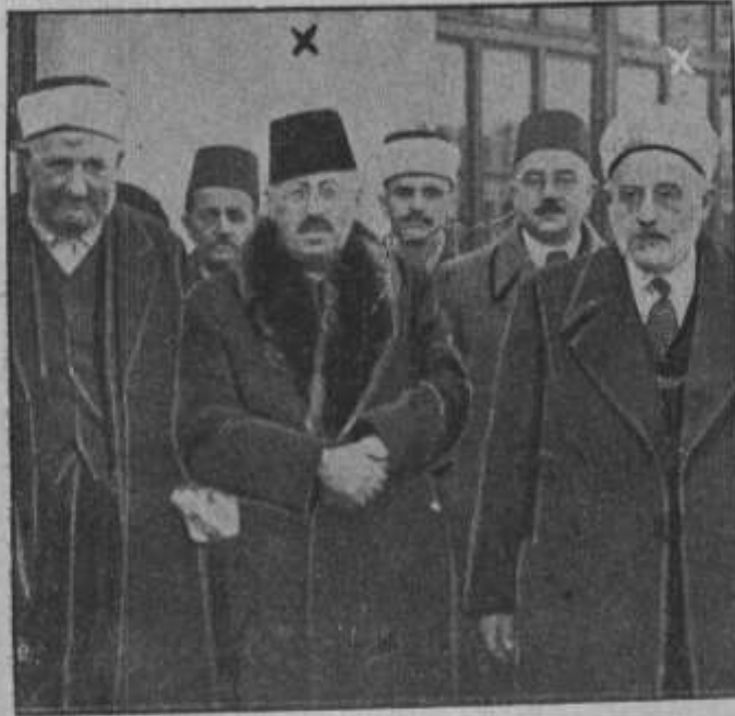
استقبال الأمير شكيب في محطة سيراجيفو ببلاد البوسنة والهرسك «أوغوسلافيا» سنة ١٩٣٥م وإلى يمينه المرحوم الدكتور محمد بك سباهو وزير المواصلات فالمرحوم السيد سالم مفيتيح مفتي البوسنة ورئيس العلماء

الملحق رقم (14): إستقبال الأمير في محطة سيراجيفو ببلاد البوسنة والهرسك يو غسلافيا سنة 1935م وإلى يمينه المرحوم الدكتور محمد بك سباهو وزير المواصلات فالمرحوم السيد سالم مفيتيح مفتي البوسنة ورئيس العلماء المرحوم الأمير شكيب يجاهد في بنغازي وطرابلس الغرب سنة 1911 ويظهر مع رفاقه خلف الماتريس وهو الثاني من اليمين القارئ وأما الثالث فهو المرحوم أنور باشا والرابع كمال باشا " أتاتورك " وحولهم بعض الضباط.