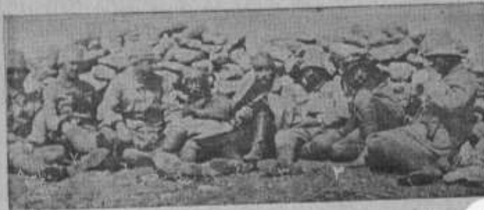
544 يوم الأمير شكيب يجاهد في بنغازي وطرابلس الغرب سنة ١٩١١ ويظهر مع رفاقه خلف الماتريس وهو الثاني من اليمين القارئ وأما الثالث فهو المرحوم أنور باشا والرابع مصطفى كمال باشا « أتاتورك » وحولهم بعض الضباط