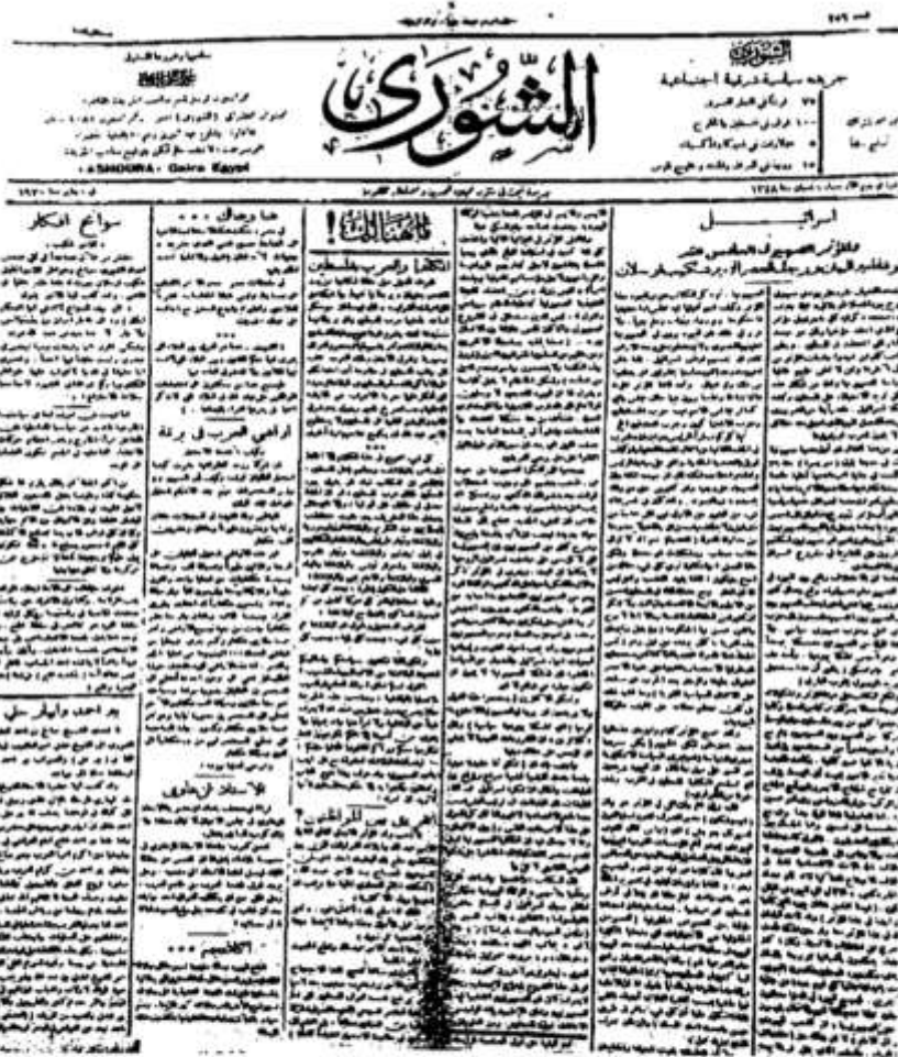
الصفحة الأولى من العدد 256 من جريدة الشورى حيث نشرت الحلقة الأولى من (سوانح أفكار) في الجانب العلوي الأيسر ويظهر مقالة لشكيب أرسلان يمين الصفحة بعنوان (إسرائيل) والمؤتمر الصهيوني السادس عشر)

الملحق رقم (22): صفحة الأولى من العدد 256 من جريدة الشورى حيث نشرت الحلقة الأولى من سوانح الأفكار في الجانب العلوي الأيسر ويظهر مقالة لشكيب أرسلان يمين الصفحة بعنوان (إسرائيل) والمؤتمر الصهيوني السادس عشر).