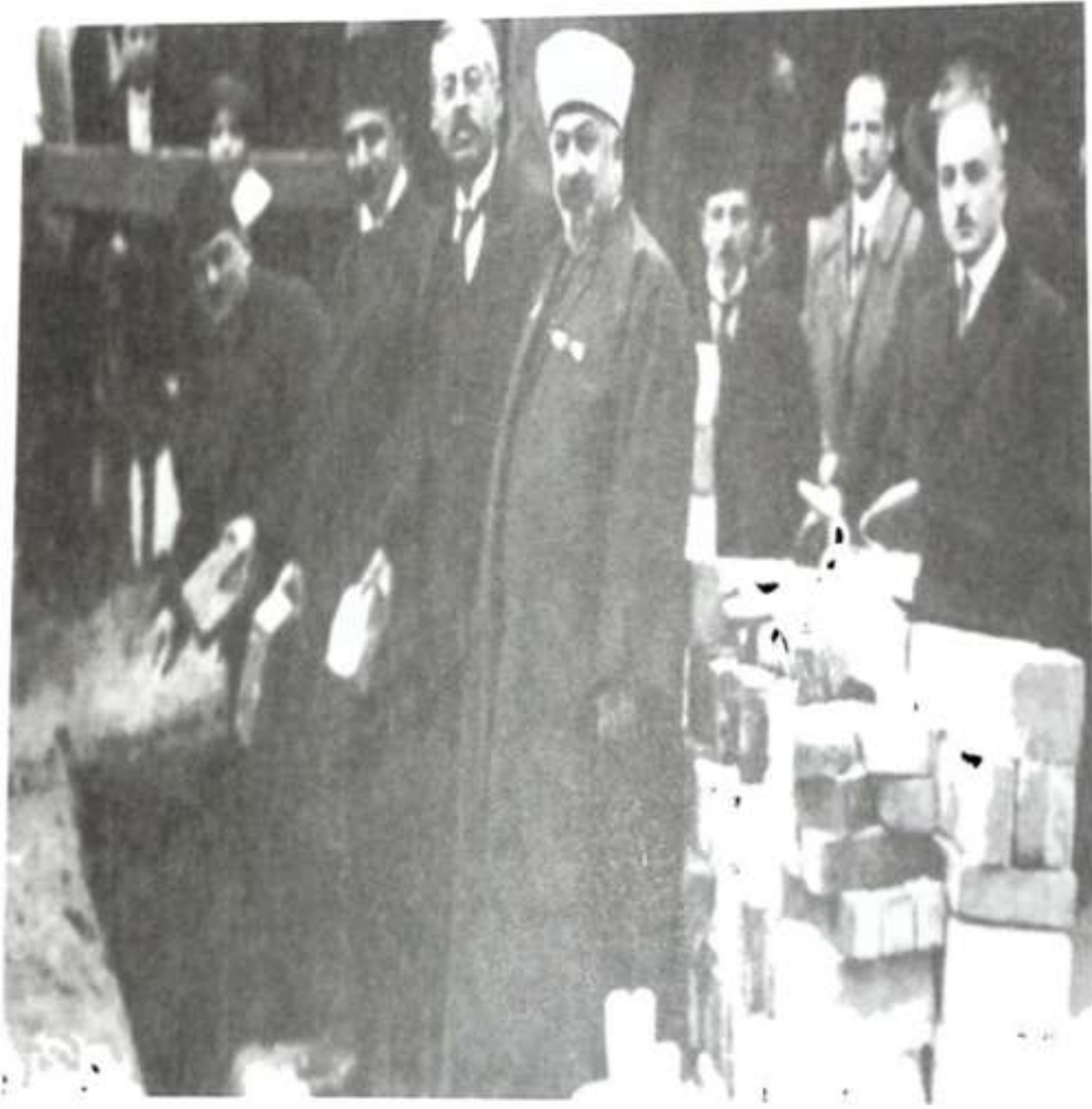
الأمير شكيب، وإلى يساره الشيخ عبد العزيز جاويش، أثناء تدشين مقبرة المسلمين في برلين عام ١٩٢١.

الملحق رقم (18): الأمير شكيب عبد العزيز جاويش أثناء تدشين مقبرة المسلمين في برلين 1921 م.