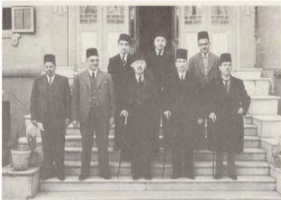
شكيب في زيارة إلى دار رشيد رضا بالقاهرة 1939م

الملحق رقم (04): شكيب أرسلان في دار رشيد رضا بالقاهرة 1939م، محمد علي الطاهر مودعا شكيب في الإسكندرية متجها نحو سويسرا