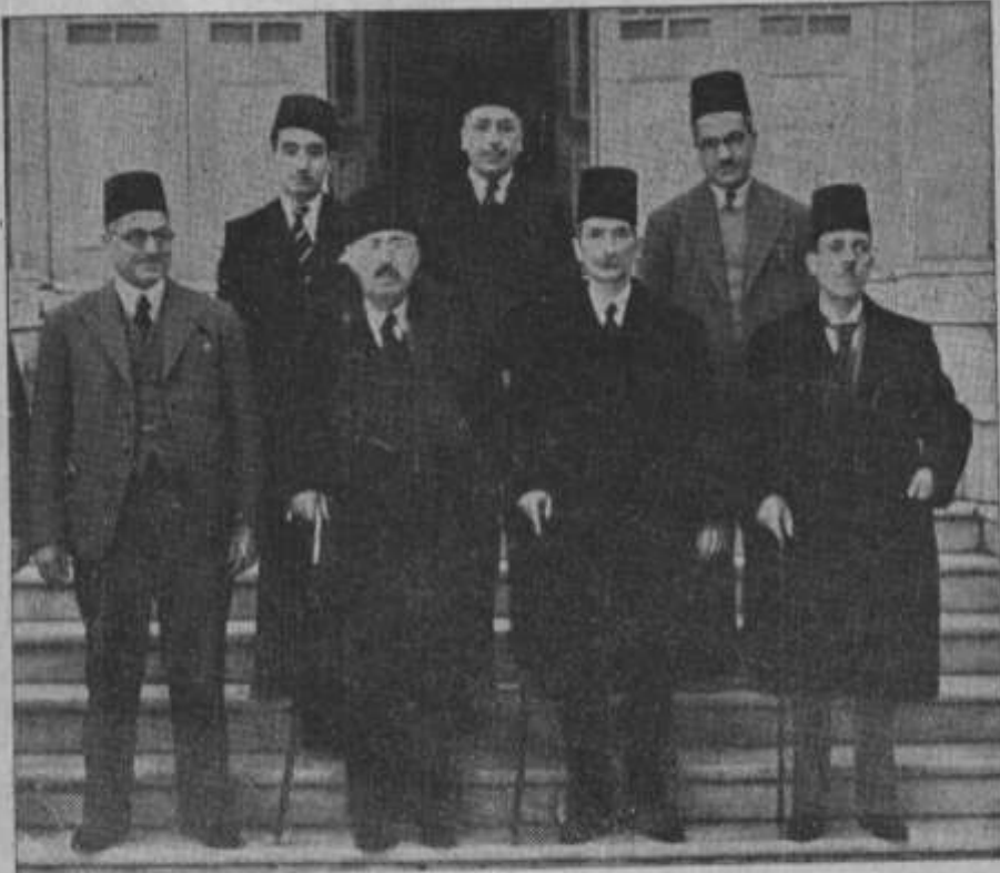
الأمير شكيب في القاهرة سنة ١٩٣٩ يزور دار الإمام السيد رشيد رضا ، وهو الثاني من يسار القارئ* وبجواره الأستاذ عبد الله أمين وإلى يساره أحمد حلمي باشا الزعيم الفلسطيني فمحمد علي الطاهر ووقف خلفهم من اليمين السادة محي الدين رضا وعبد الغني رضا والمعتصم بك رضا ، ثاني أنجال الإمام

الملحق رقم (10): الأمير شكيب في القاهرة سنة 1939 يزور دار الإمام السيد رشيد رضا، وهو الثاني من يسار القارئ وبجواره الأستاذ عبد الله أمين وإلى يساره حلمي باشا الزعيم الفلسطيني فمحمد علي الطاهر ووقف خلفهم من اليمين السادة محي الدين رضا وعبد الغني رضا والمعتصم بك رضا، ثاني أنجال الإمام