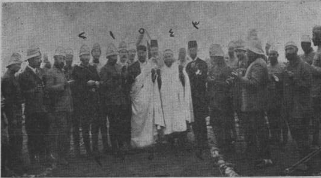
صورة تاريخية أخذت للأمير شكيب في حرب إيطاليا مع الدولة العثمانية بطرابلس الغرب سنة 1911 وهي تجمع فريقاً من المجاهدين والقواد والحكام وهم يبتهلون إلى الله بنصر المجاهدين، وقد ظهر فيها رقم (1) المرحوم أنور باشا (2) الغازي مصطفى كامل باشا « أتاتورك » (3) الأمير شكيب أرسلان (4) الشيخ صالح تونسي (5) عبد القادر بك الغنامي رحمهم الله جميعاً

الملحق رقم (13): صورة تاريخية أخذت للأمير شكيب في حرب إيطاليا مع الدولة العثمانية بطرابلس الغرب سنة 1911 وهي تجمع فريقاً من المجاهدين والقواد والحكام وهم يبتهلون إلى الله بنصر المجاهدين وقد ظهر رقم واحد المرحوم أنور باشا، 2 الغازي مصطفى كامل باشا " أتاتورك "، 3 الأمير شكيب أرسلان، 4 الشيخ صالح تونسي، عبد القادر بك الغنامي رحمهم الله جميعاً