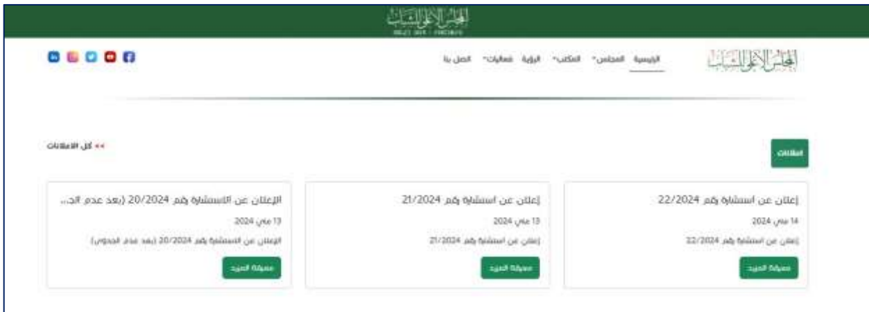
الصورة رقم (4): توضح اعلانات الاستشارة المجلس الوطني للشباب