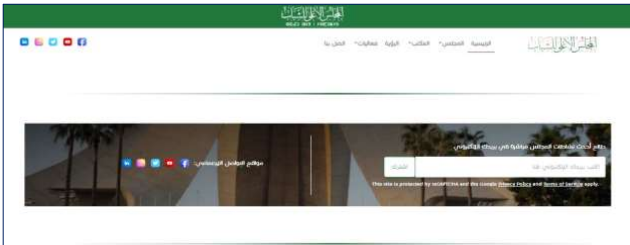
الصورة رقم (5): توضح خدمة الاطلاع على نشاطات المجلس الوطني للشباب عبر البريد الالكتروني