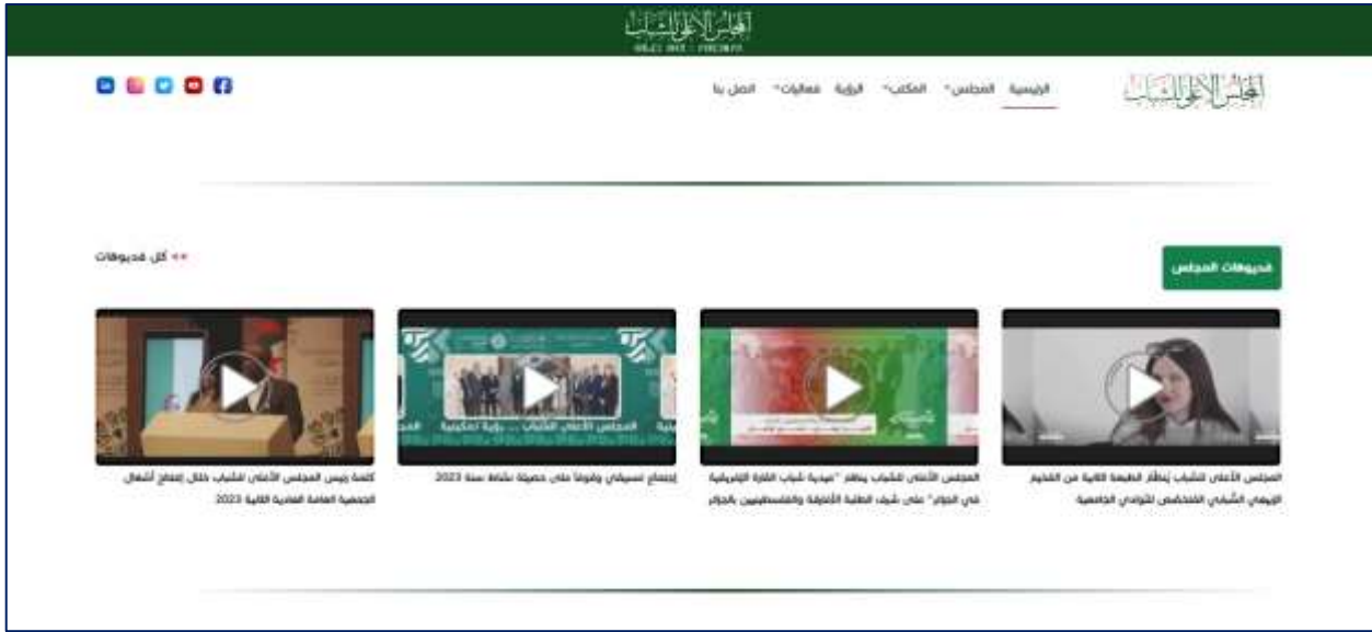
الصورة رقم (3): توضح صفحة فيديو هات المجلس الوطني للشباب