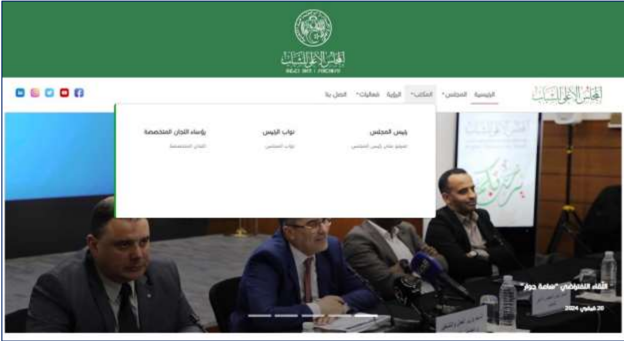
الصورة رقم (8): توضح صفحة مكتب المجلس الوطني للشباب (نواب الرئيس واللجان المتخصصة)

* النصوص القانونية: هناك نصوص قانونية من مراسيم رئاسية وتنفيذية توضح القانون الداخلي للمجلس الأعلى للشباب وطرق تسييره تتمثل في: 1 - مرسوم رئاسي رقم 21-416 مؤرخ في 20 ربيع الأول 1443 الموافق 27 أكتوبر 2021، يحدد مهام المجلس الأعلى للشباب وتشكيلته وتنظيمه وسييره. - مرسوم رئاسي مؤرخ في 14 ذي القعدة 1443 الموافق 14 جوان 2022، يتضمن تعيين رئيس المجلس الأعلى للشباب. - مرسوم تنفيذي رقم 22-402 مؤرخ في 29 ربيع الثاني عام 1444 الموافق 24 نوفمبر 2022 يحدد تنظيم الأمانة الإدارية والتقنية للمجلس الأعلى للشباب. - مرسوم رئاسي رقم 23-58 مؤرخ في 3 رجب عام 1444 الموافق 25 جانفي سنة 2023، يتضمن الموافقة على النظام الداخلي للمجلس الأعلى للشباب. 3- المكتب : في هذه الصفحة يمكنك التعرف على رئيس المجلس، ونواب الرئيس، ونواب المجلس، ورؤساء اللجان المتخصصة، واللجان المتخصصة.