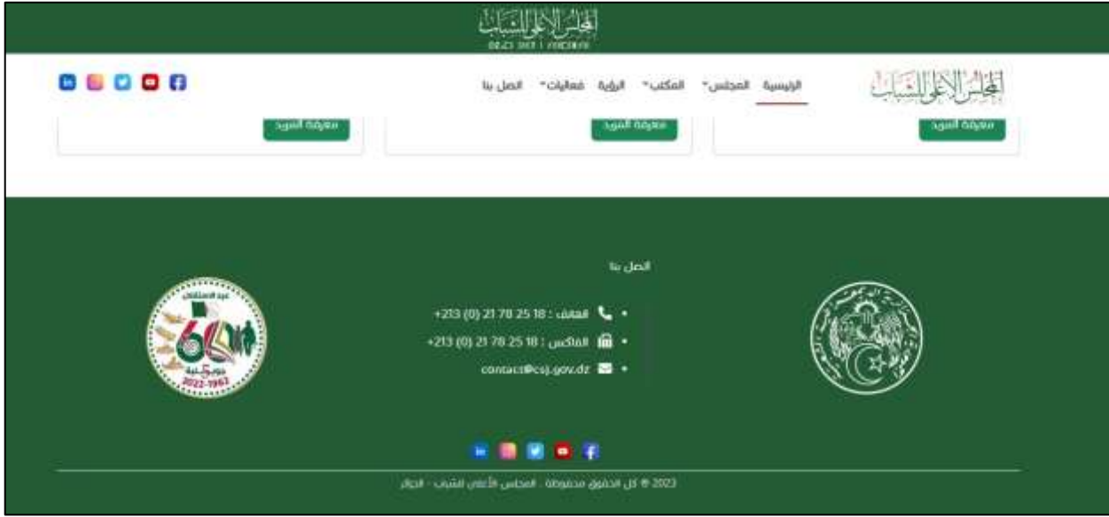
الصورة رقم (11): توضح ركن "اتصل بنا" المجلس الوطني للشباب

6- اتصل بنا : يجد الزائر للموقع أرقام الاتصال بالمجلس من خلال رقم الهاتف والفاكس والبريد الإلكتروني للمجلس الأعلى للشباب.