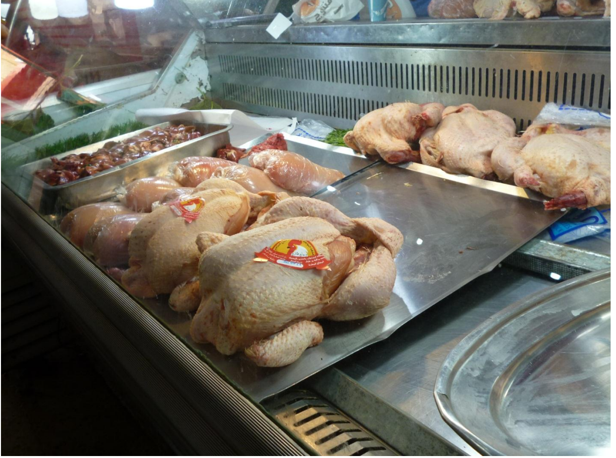
صورة للحوم البيضاء