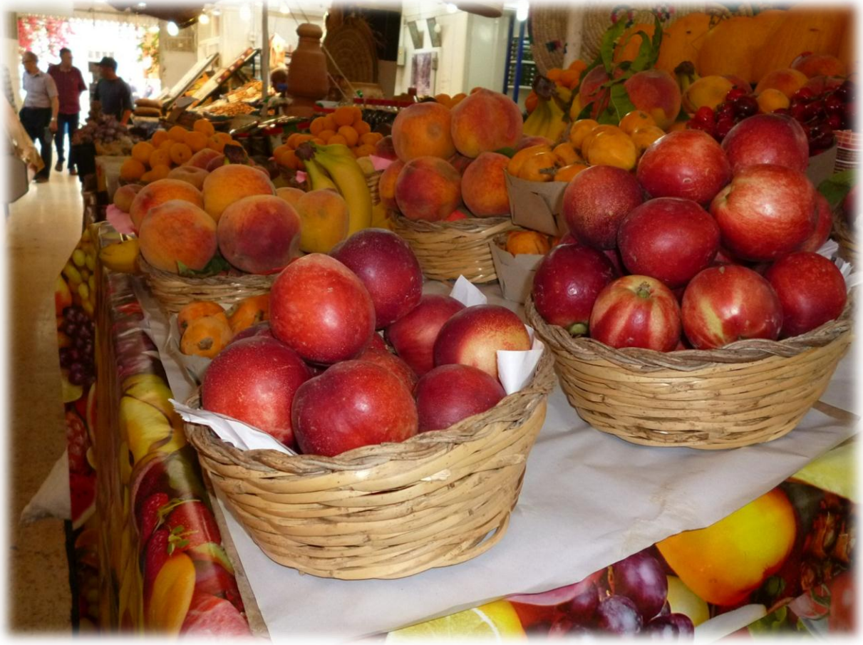
صورة لطاولة الفواكه