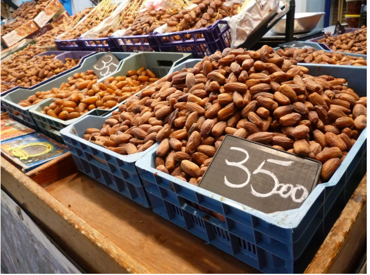
صورة لطاولة التمور