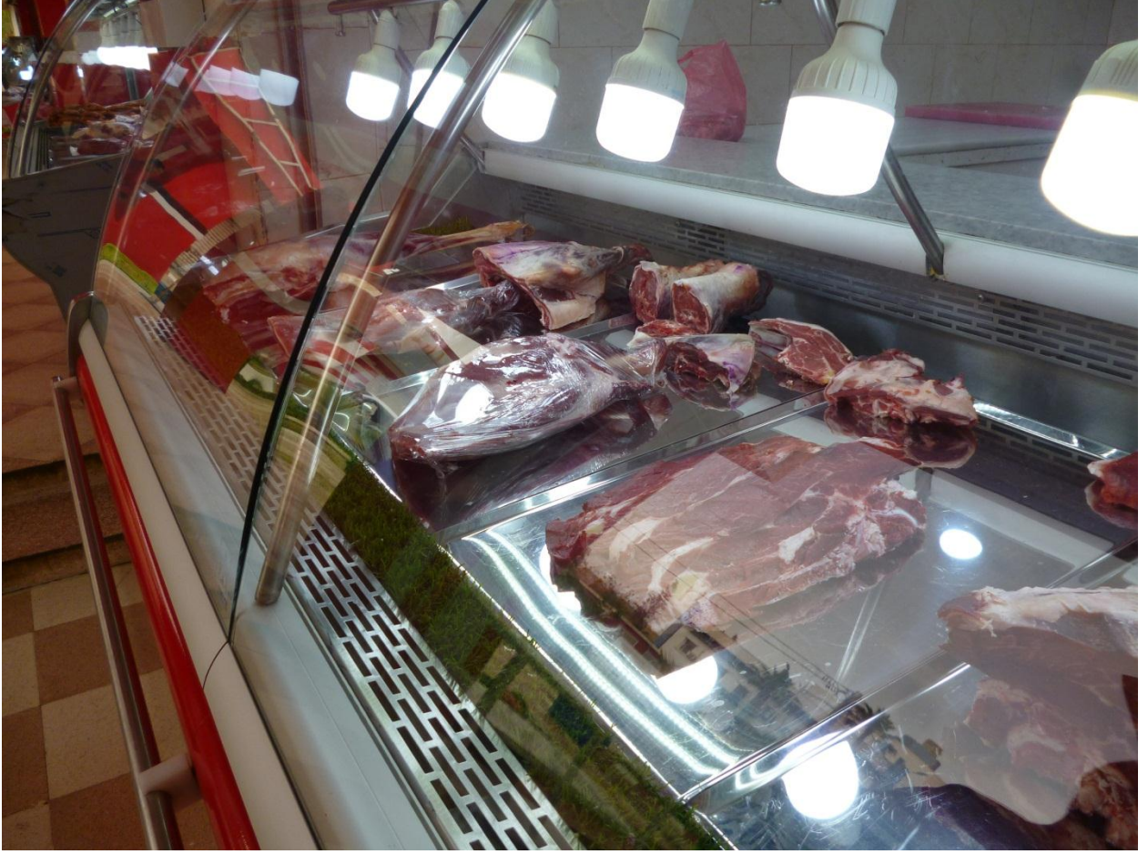
صورة للحموم الحمراء