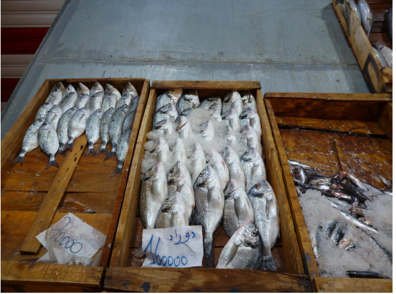
صورة لطاولة الأسماك