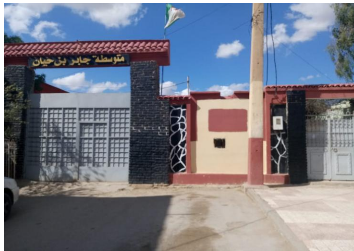
Figure 1 CEM de Djaber Ben Hayan

Nous avons choisi la daïra d' « Ouled Derradj », qui se situe à 20 Km à l'est de la willaya de M'sila, pour effectuer notre étude, car elle est considérée comme un milieu semi urbain où se trouve presque tous les besoins d'apprentissage, et une grande densité populaire, également la disponibilité des établissements scolaires, par la suite, nous avons choisi le CEM de Djaber Ben Hayan parce qu'il englobe des élèves de centre ville et les élèves des enivrons rurales, ce qui aide dans notre étude.