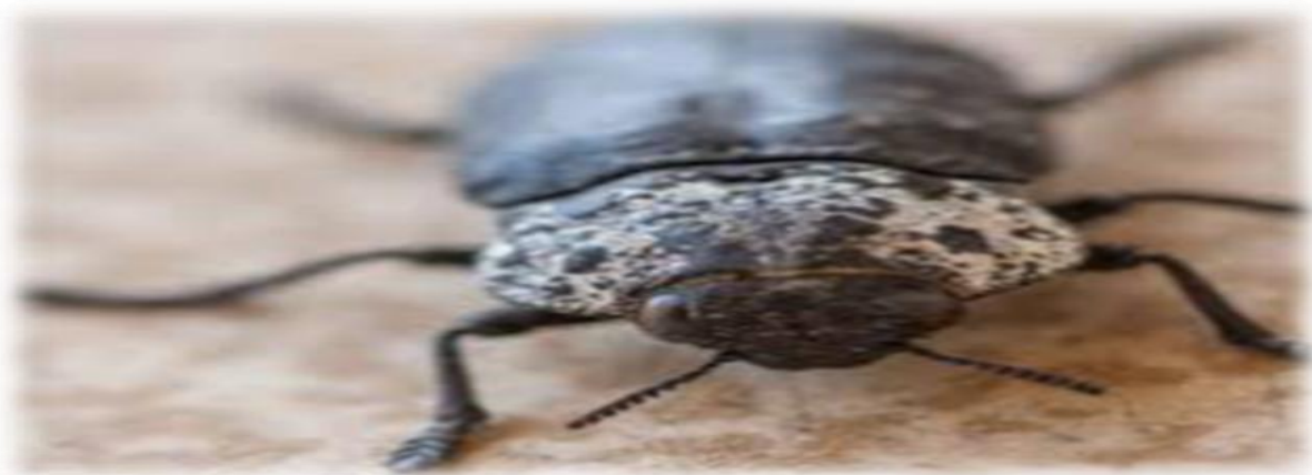
Photo 5: Capnoïde adulte.

Pour l'olivier dans ce verger, on a remarqué le recourt à plusieurs techniques pour l'amélioration de cet arbre, entre autre, l'irrigation régulier ; le traitement des arbres contre les maladies ; la fertilisation et le greffage, ainsi la distance de plantation entre arbres ( 6m entre arbre et autre)