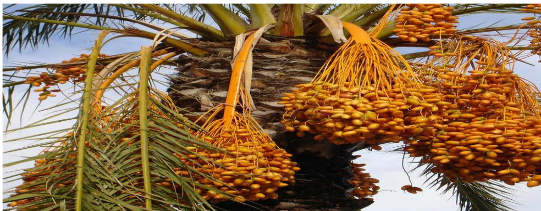
Figure 7 :arbre de palmier dattier (www.aujardin.info).

Le Palmier dattier est une plante monocotylédone à croissance apicale dominante. Le diamètre du tronc de l'arbre demeure généralement stable sous les mêmes conditions à partir de l'âge adulte (Sedra, 2003), Les feuilles, réunies en un nombre de 20 à 30 maximums, forment une couronne apicale clairsemée. Elles sont pennées, longues jusqu'à 6m; les feuilles supérieures sont ascendantes, les basales recourbées vers le bas, avec des segments coriaces, linéaires, rigides et piquants, de couleur verte. (Sbiai, 2011). Les fleurs sont unisexuées à pédoncule très court. Elles sont de couleur ivoire, jaune-verdâtre selon le sexe et le cultivar ou la variété ; Le fruit est une baie contenant une graine appelée communément, noyau (Figure 7) (Sedra ,2003).