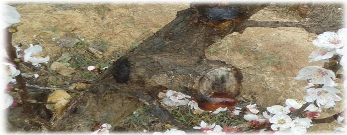
Photo 3 : la gommose sur le tronc d'arbre d'abricotier.

- Le puceron vert : C'est un insecte vif au dessous de la feuille d'arbre qui consomme la feuille (Prise de photo 4).