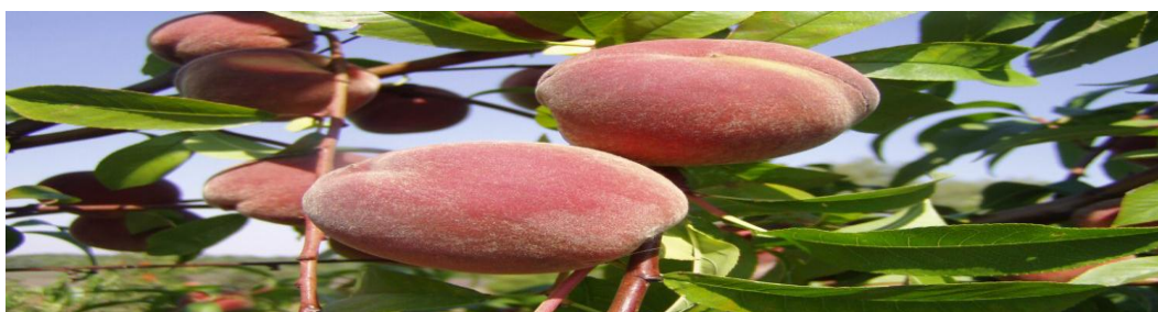
Figure 4 : arbre de Pêcher (www.aujardin.info).

Le fruit est une drupe charnue de forme globulaire. La forme et la taille sont caractéristiques de la variété. Le fruit est caractérisé par une cavité abrupte bien distincte, et un apex avec un mucron. La couleur du fruit varie du blanc verdâtre à jaune-orange, et peut être rouge sur les côtés exposés au soleil. La peau (épicarpe) est adhérente et la chair (mésocarpe) est blanc-verdâtre ou jaunâtre teintée de rouge. Le fruit présente une forme elliptique ovoïde parfois plate avec un noyau aromatique et amer. (ZAGHDOUDI, 2015).