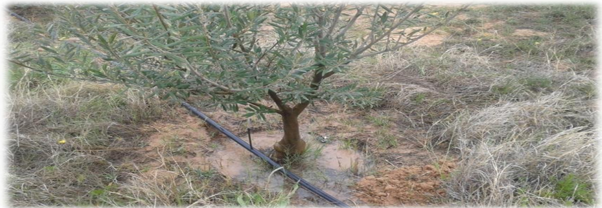
Photo2 : Irrigation goutte à goutte.(source original) .

Le système d'irrigation consiste en deux tubes à goutteurs intégrés dont le modèle choisi est de type « Uniram » fabriqué par « Netafim Ltd ». Ce système est composé d'un tube en polyéthylène de haute qualité intégrant un véritable goutteur autorégulant et anti-siphon. La gamme de la pression de fonctionnement est de 0.05 à 0.4 MPa., et la dépression est assurée par un système de labyrinthe « Turbonet ». En cas d'arrêt des apports d'eau, ces derniers arrêtent l'alimentation aux systèmes racinaires. La source d'eau est un fourrage à qualité d'eau douce (Prise de photo 3).