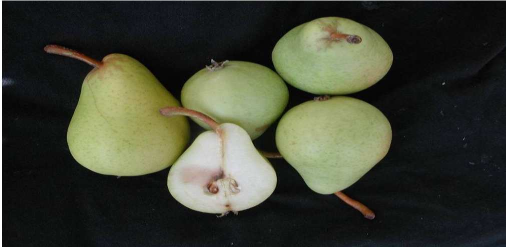
Figure 8: fruit de Poirier.