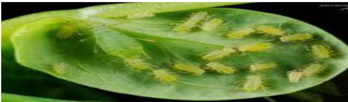
Photo4 : Insectes des pucerons verts. (futura-sciences.com).

- Le puceron vert : C'est un insecte vif au dessous de la feuille d'arbre qui consomme la feuille (Prise de photo 4).