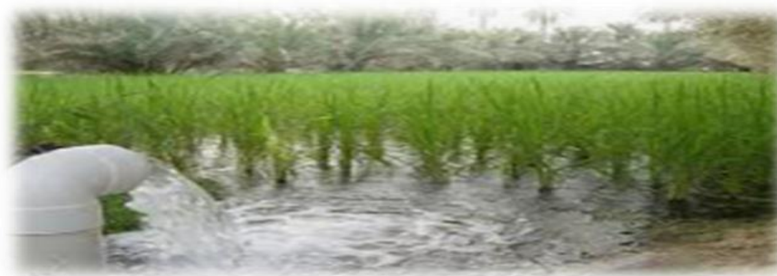
Photo 7 : Irrigation traditionnelle (Séguia).

Le sol de cette région est argileux, l'irrigation est traditionnelle par la « Séguia » qui est un canal de dérivation et de collecte des eaux réalisé en terre ou en pierre agencées permettant d'amener l'eau prise dans l'Oued vers les parcelles à irriguer à l'aide d'une digue rudimentaire (Barrage ElKsob) ( Prise de photo7).