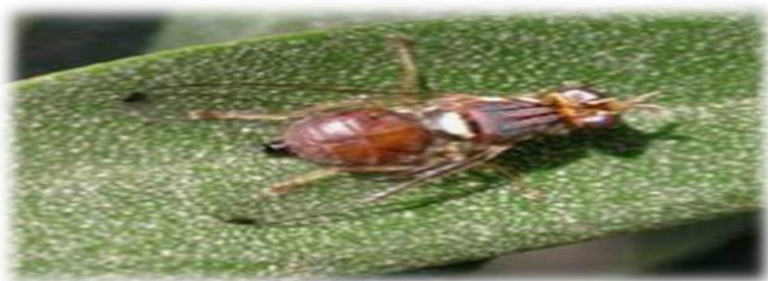
Photo 9 : Mouche de l'olivier.

Pour l'abricotier, c'est la même maladie décrite précédemment (La gommose), alors que pour l'olivier, c'est la mouche de l'olivier qui pique le fruit et pond à l'intérieur. Des asticots naissent dans l'olive. On remarque des petits trous dans les fruits. Actuellement, le seul traitement efficace est le traitement chimique (Prise de photo9)