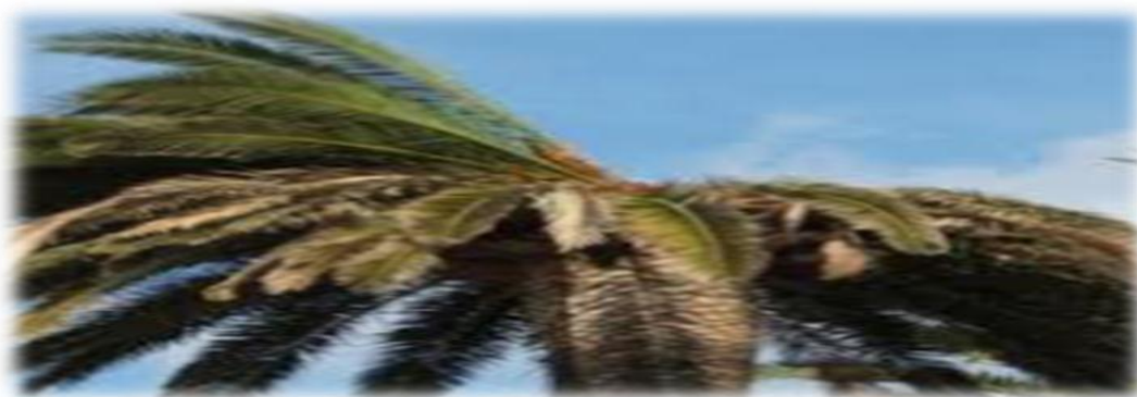
Photo 10: Influence du Bayoud sur les palmes du palmier dattier

Pour ce qui est de la distance de plantation on peut citer par exemple la distance pour le verger d'olivier qui est de 6/6m, l'abricotier est de 6/6m, le grenadier est de 4/4m, le figuier est de 7/7m et le palmier dattier qui est de 8/8m.