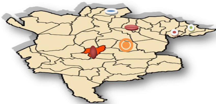
Figure 12: Délimitation de l'aire d'étude.

Dans le cadre de la prospection des cultivars locaux d'arboriculture fruitière dans la wilaya de M'sila, des inventaires dans les régions suivantes principalement (Maadher, Ain khadra, Magra, Ouled Bedera, Khoubana, Hammam Delaa) ont été élaborés. Le choix de ces régions est justifié par la DSA (direction des services agricoles), pour les variétés les plus abondantes dans la wilaya de M'sila.