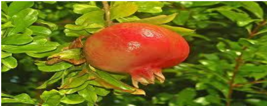
Figure 9 : arbre de grenadier (www.aujardin.info).

environ la moitié du fruit. Dans chaque pépin, la graine est enrobée d'une pulpe gélatineuse de chair rouge transparente, sucrée chez les variétés améliorées, sinon d'un goût plutôt âcre (Figure 9) (Benabdennebi, 2012).