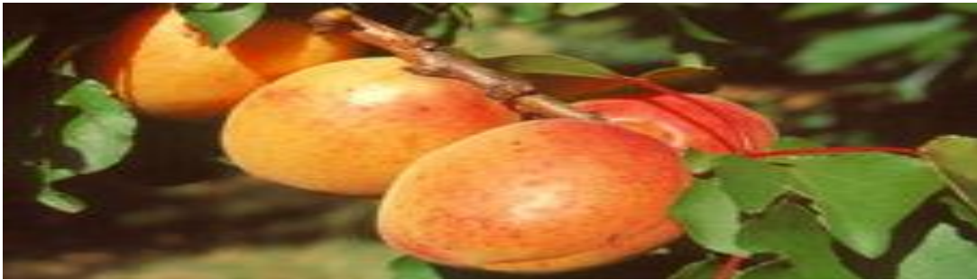
Figure 3 : arbre d'abricotier.