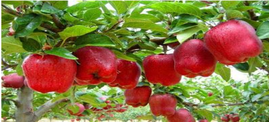
Figure 6 : arbre de pommier (botanic.com).