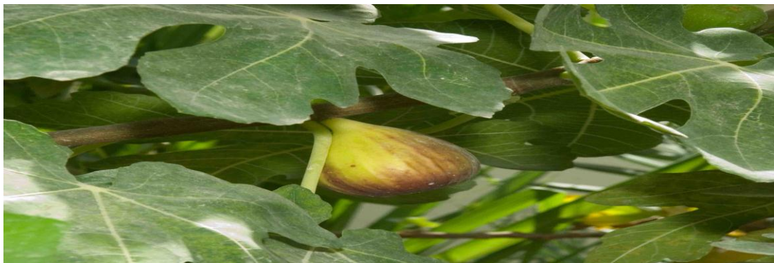
Figure 10 : arbre de figuier.

Le figuier est un arbre généralement buissonnant (3-5m), il peut atteindre, dans certains régions qui lui conviennent particulièrement, jusqu'à 10 et 12m de hauteur, avoir un tronc allant jusqu' à 1m (Vidaud, 1987). Le figuier présente de large feuilles charnues de 10 à 20cm de long et large elles sont caduque, vert foncé, épaisses et alternées. Les fleurs sont petites et regroupées en inflorescences et sont hermaphrodites (Figure 10) (Bouzid ,2012).