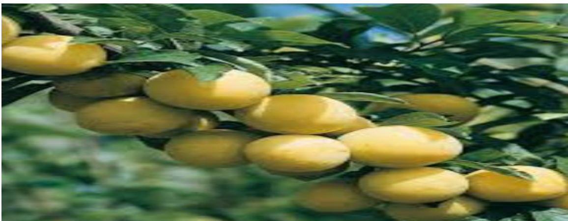
Figure 5 : Prunier.

Le prunier est un arbre de taille moyenne (entre 3et 8m), parfois épineux, qui fleurit tôt au printemps (Mars/Avril). Les fleurs blanches apparaissent avant les feuilles sur des rameaux de l'année précédente .le fruit, la prune est de forme plus ou moins sphérique ou oblongue glabre et couvert de pruine.