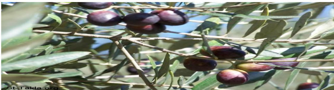
Figure 11 : arbre d'olivier.

L'olivier est un arbre cultivé dans les pays méditerranéen pour son fruit, l'olive, qui donne une huile recherchée. Le tronc est le principal support de l'arbre (un soutien à l'arbre); sur jeune arbre, le tronc est lisse de couleur grise verdâtre. Les fleurs sont petites et regroupées en inflorescences et sont hermaphrodites (Haouane, 2012). La forme du fruit peut être sphérique, ovoïde ou allongée. La longueur du fruit et celle du noyau sont le caractère le plus héréditaire (Fantanazza et Baldini, 1990). Les fleurs sont petites et regroupées en inflorescences et sont hermaphrodites (Figure 11).