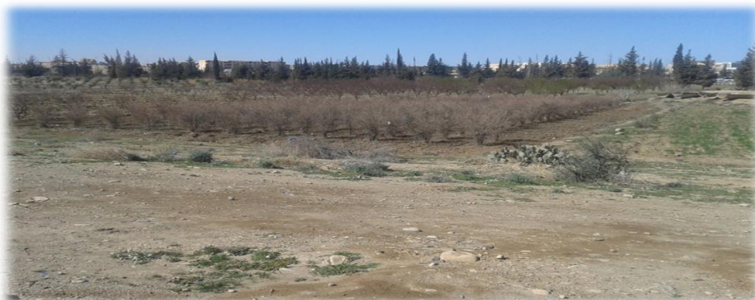
Photo6 : Verger d'Ouled Bedera. .

Le sol de cette région est argileux, l'irrigation est traditionnelle par la « Séguia » qui est un canal de dérivation et de collecte des eaux réalisé en terre ou en pierre agencées permettant d'amener l'eau prise dans l'Oued vers les parcelles à irriguer à l'aide d'une digue rudimentaire (Barrage ElKsob) ( Prise de photo7).