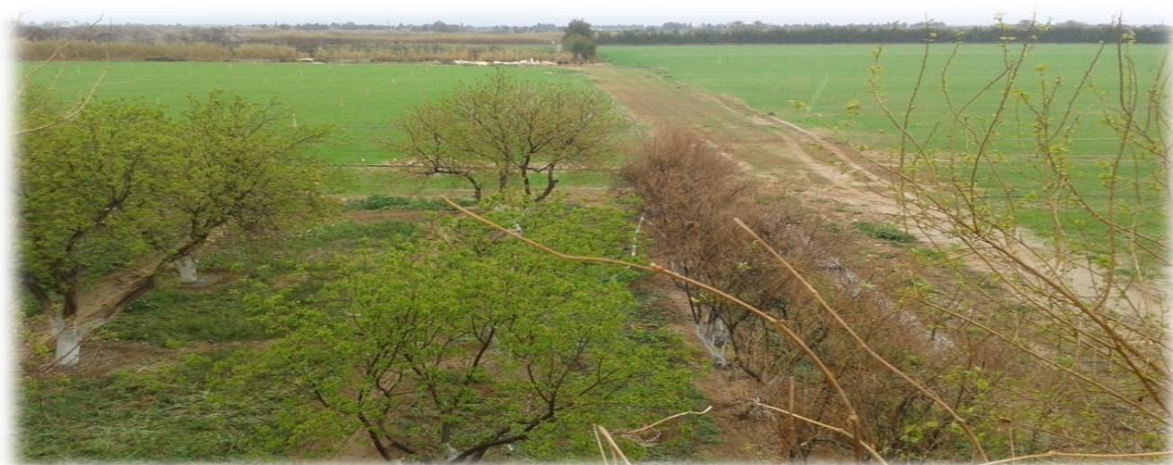
Photo8: verger d'ElMaadher.

La surface totale de verger est de 70 hectares ; dont 69,75 hectares est la surface exploitée (99,64%). La culture fruitière est axée sur l'abricotier avec (40,48%). Les variétés existantes dans ce verger est la variété Paviot avec 50 arbres et la variété Boulidi avec 50 arbres, suivie de l'oléiculture représentant ainsi (40,81%) avec l'existence de deux variétés, à savoir, la variété Chemlel avec 40 arbres et la variété Sigoise avec 20 arbres. Le grenadier occupe (10,20%) représenté par la variété "Sinin Leajoule", et le figuier avec (16,32%), représenté par les variétés "Elbakour et Karmoss" et enfin la culture du palmier dattier avec environ (8,16%) manifestée par la variété "Deglet Nour" et la variété "Gharess". Dans ce verger la culture sous-jacente n'existe pas. Le climat de cette région est désertique et l'âge des arbres fruitiers est autour de 16 ans, sauf une nouvelle plantation qui date de 2 ans (Prise de photo 8).