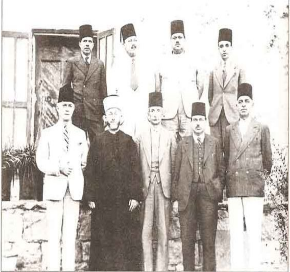
أعضاء اللجنة العربية العليا التي تأسست عام ١٩٣٦ ويظهر الحاج أمين الحسيني (صاحب العمامة)

الملحق رقم 05: أعضاء اللجنة العربية العليا.