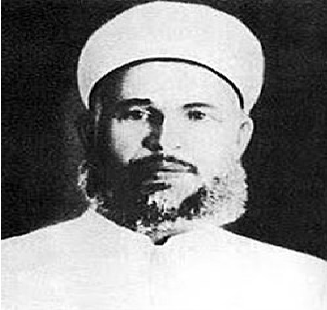
الشيخ عزالدين القسام

الملحق رقم 04: صورة الشيخ عزالدين القسام.