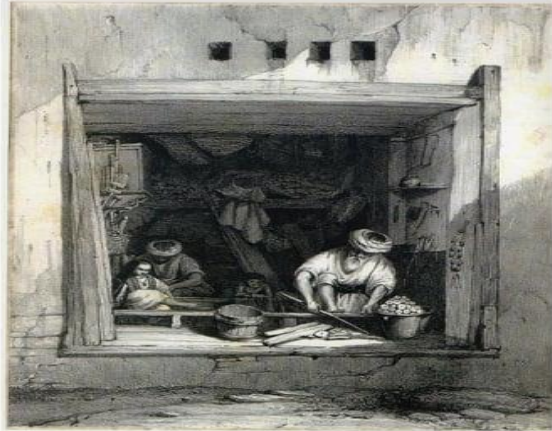
صورة 3/ الخلط على الخشب