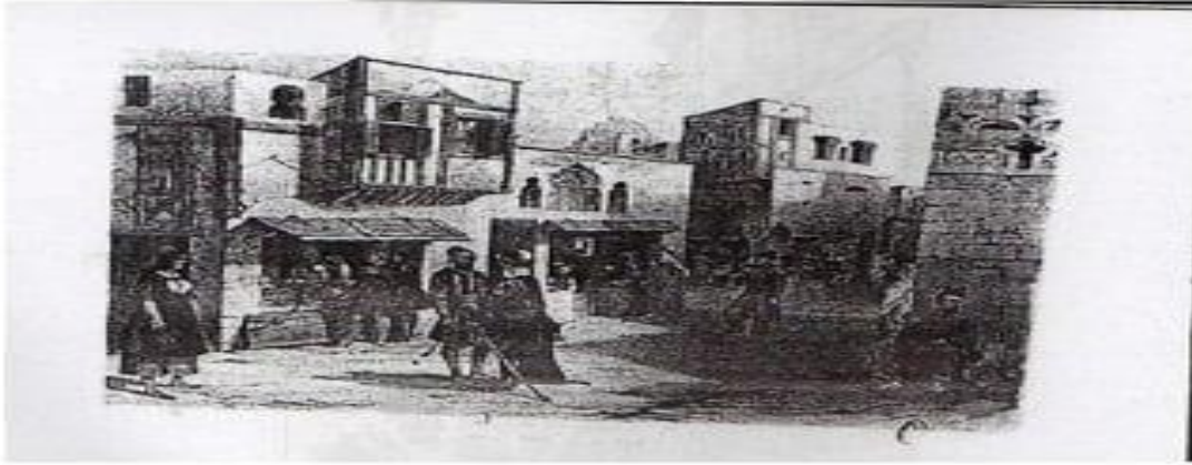
صورة 1 / الحوانيت - عن: زهية بن كردرة