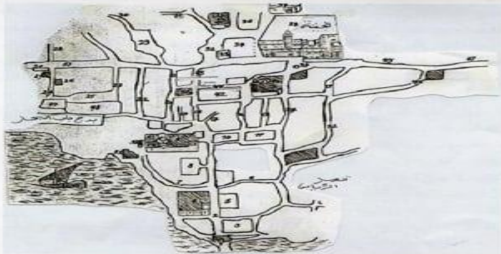
الشكل. توزيع أسواق مدينة الجزائر خلال العهد العثماني (عن إسميرت EDMIRIT)