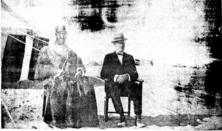
جلالة الملك الراحل والسير برسي كوكس في العقير (الخليج العربي) الميناء السعودي عام ١٣٤١ هـ = ١٩٢٢ م

حافظ وهبة: خمسون عام في جزيرة العرب، المصدر السابق، ص 118.