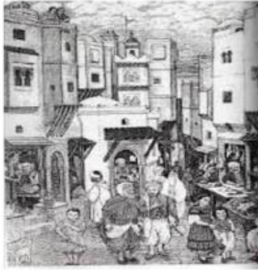
صورة لسوق الحرفيين

تناولت المؤلفة تنوع الحرف والمهن في مدينة الجزائر، وبيّنت الثراء الاجتماعي داخل هذه الفئة، وعلاقتها بباقي مكونات المجتمع المدني في الحاضرة الجزائرية كالتجار، والعلماء، والعسكر. كما كشفت عن مدى تأثير النشاط الحرفي بالتغيرات السياسية والاقتصادية، الداخلية منها والخارجية، خاصة مع تزايد الحضور الأوروبي في المجال التجاري الجزائري في أواخر العهد العثماني.