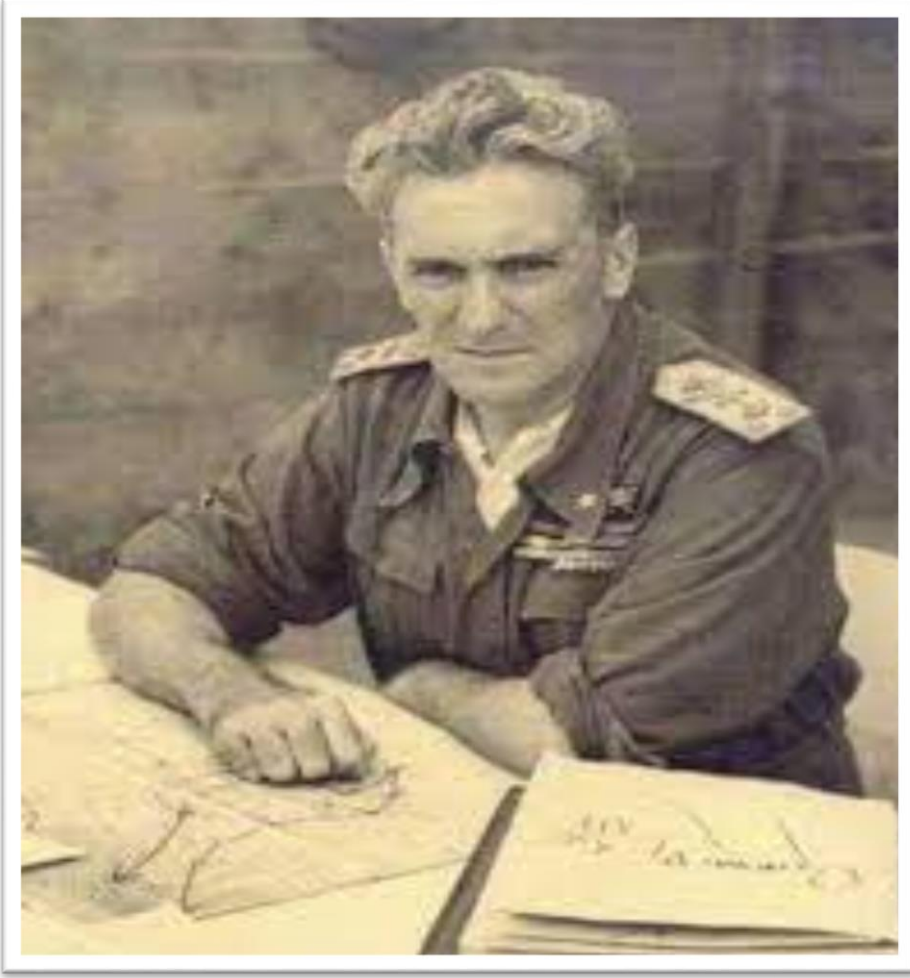
السفاح الإيطالي الشهير رودولفو غراسياني 1