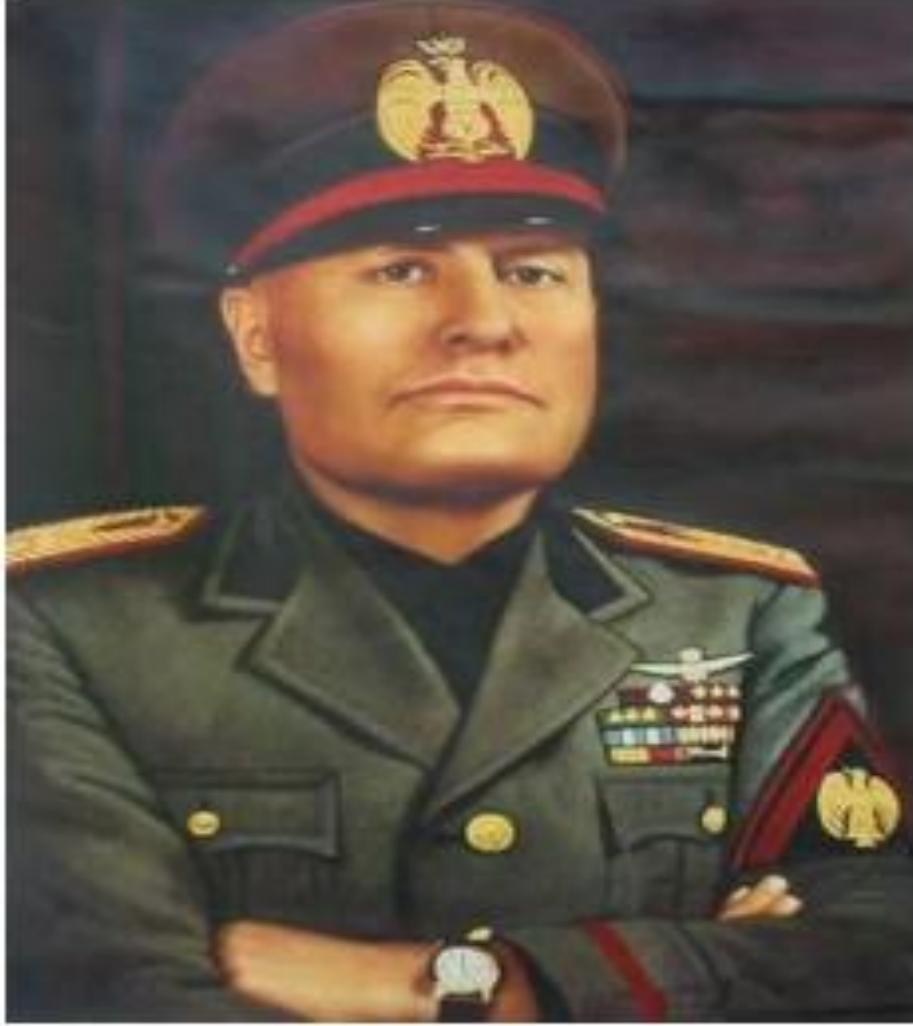
الدكتاتور الإيطالي بينيتو موسيليني 1