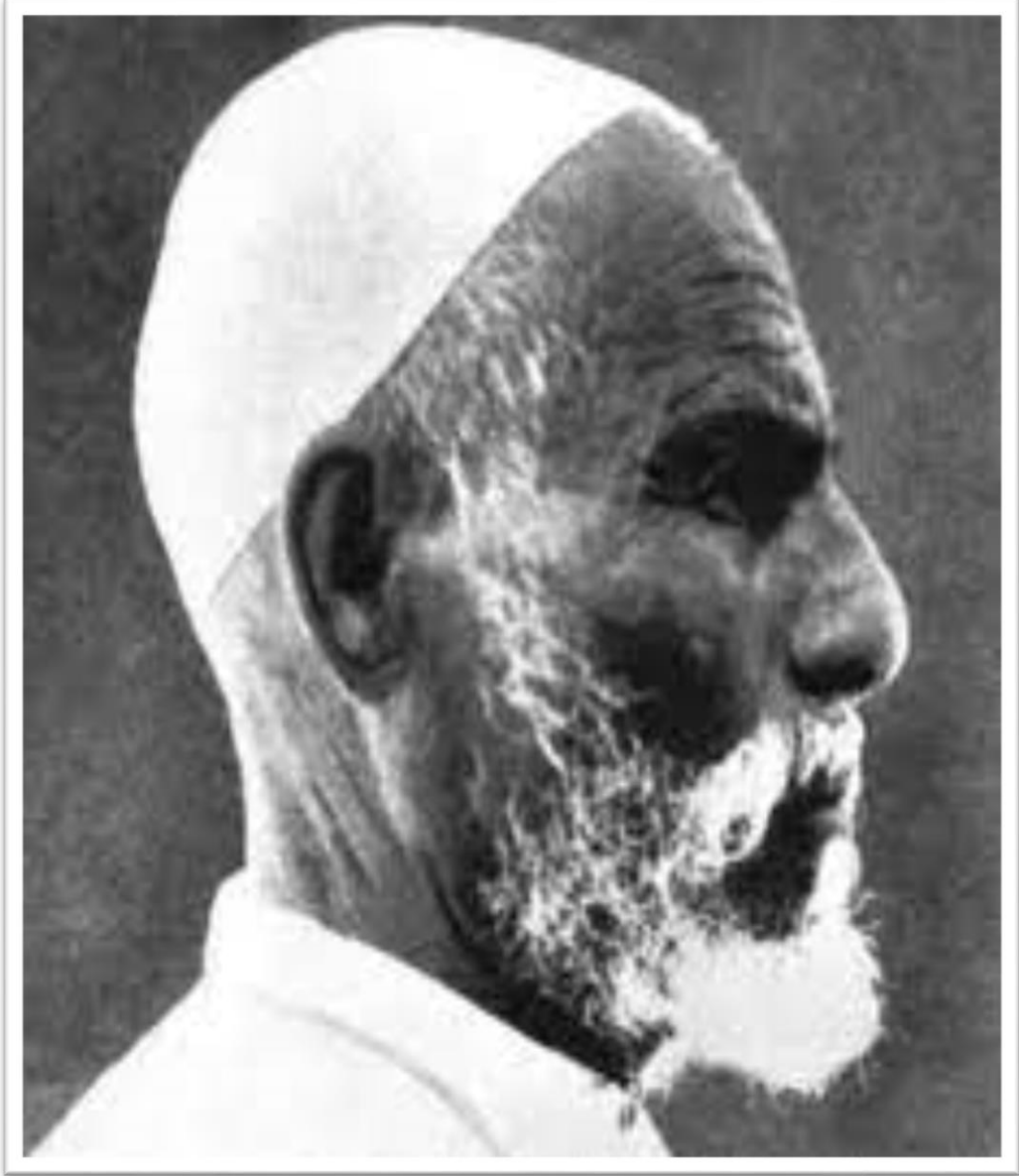
شيخ المجاهدين عمر المختار 1