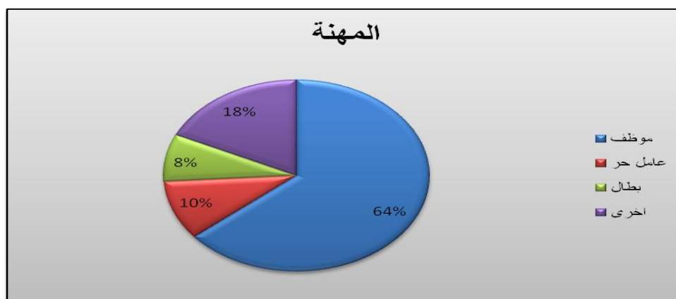
الشكل رقم (03) يوضح توزيع نسب أفراد عينة الدراسة حسب متغير المهنة

من خلال الجدول أعلاه وبالنظر إلى تكرارات أفراد عينة الدراسة والبالغ حجمهم إجمالاً (50) فرداً، نلاحظ أن (32) فرداً موظف بنسبة مئوية قدرت بـ 64% في حين بلغ عدد الأفراد العاملين الأحرار (5) فرد بنسبة مئوية بلغت 10%، أما عدد الأفراد العاطلين عن العمل (4) فرد بنسبة مئوية بلغت 8%، في حين بلغ عدد الأفراد العاملين في أعمال أخرى (9) فرد بنسبة مئوية بلغت 18%، وهذا كما هو موضح من خلال الشكل التالي: