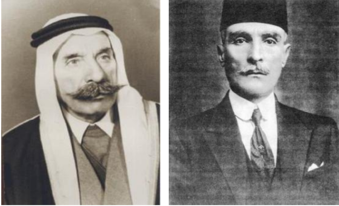
- سليمان الأطرش

المنحق رقم 04: بعض زعماء النضال السوري المسلح خلال فترة الانتداب الفرنسي 1