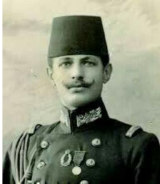
- يوسف العظمة