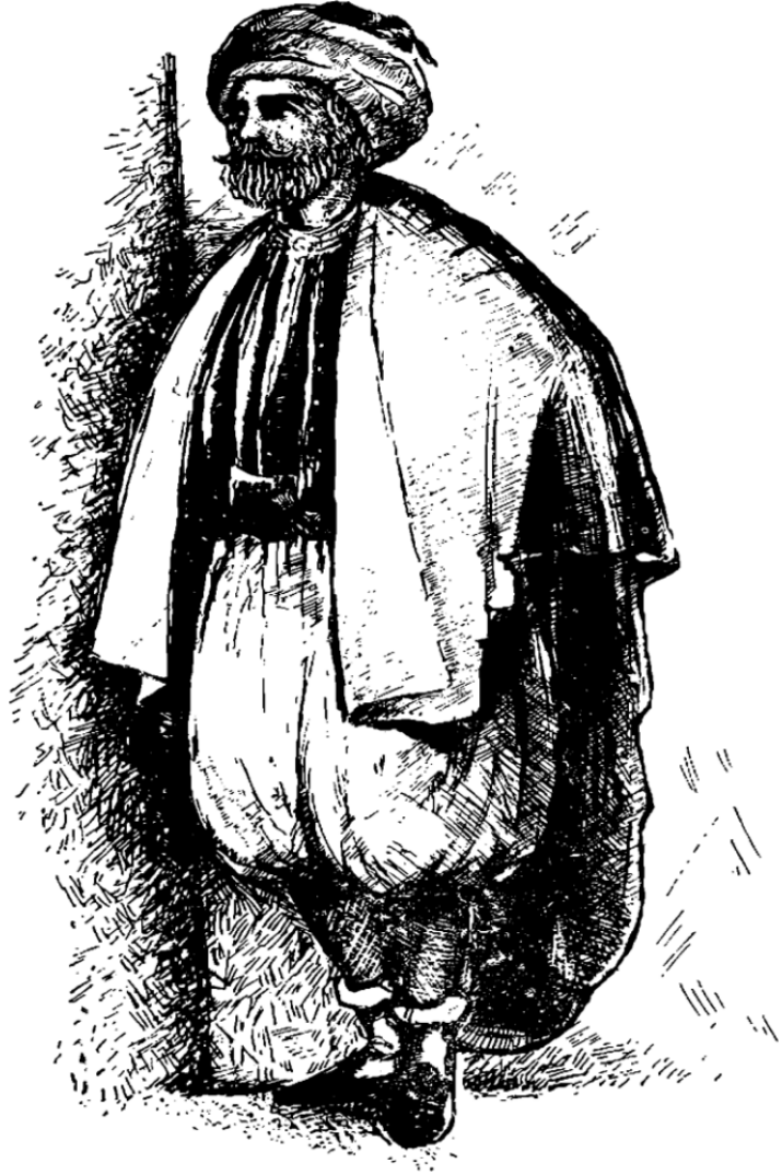
انشكل رقم 17 - حمدان بن عثمان خوجة .