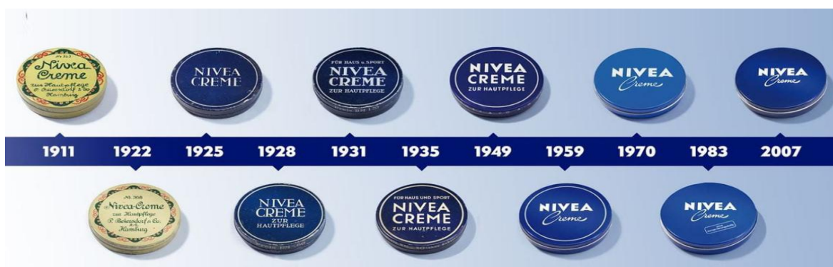
Evolution du packaging NIVEA.

NIVEA est une marque commerciale du groupe allemand Beiersdorf de produits du soin de la peau et des cheveux.