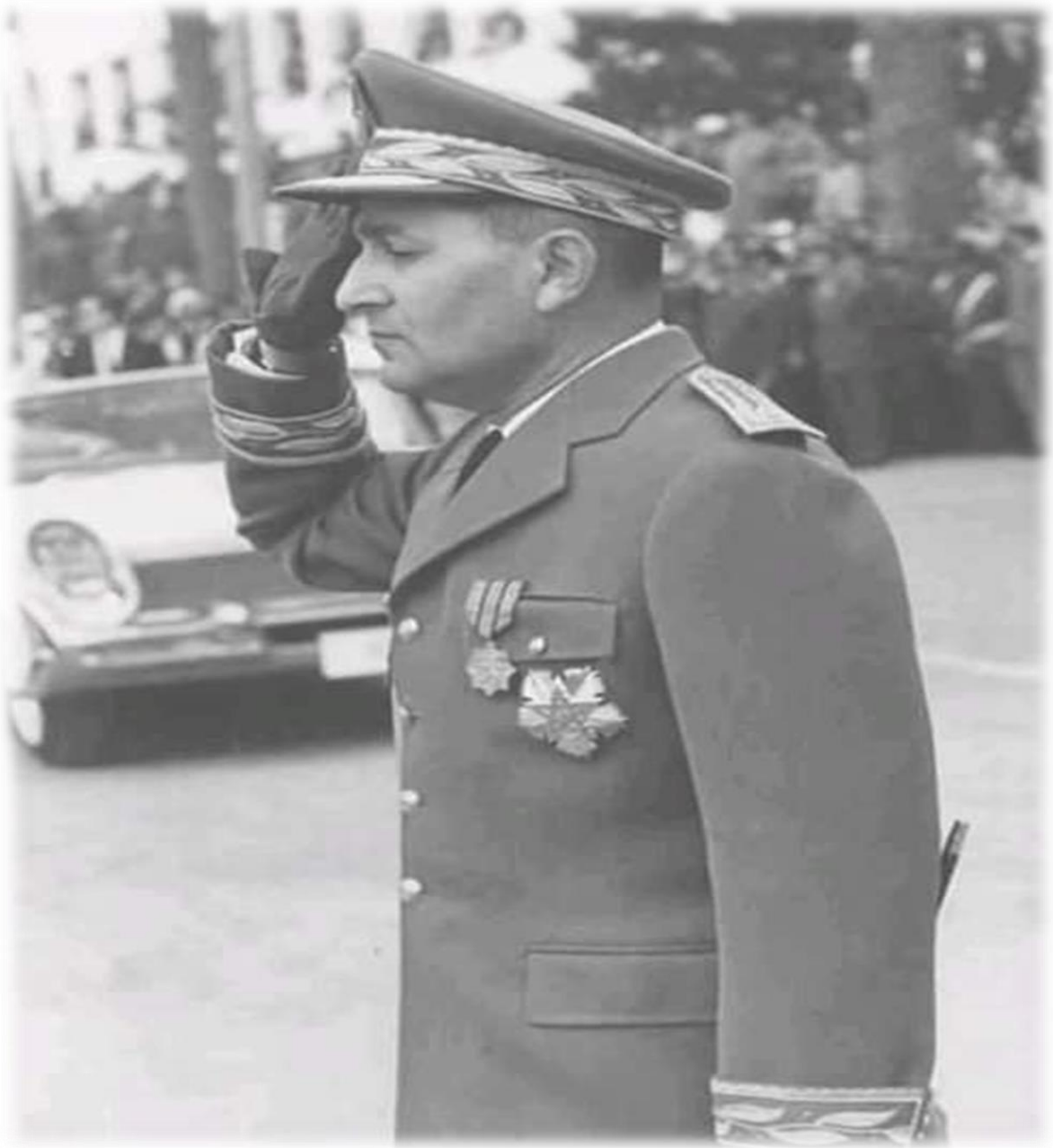
فؤاد مصطفى، محمد الخامس وكفاح المغرب العربي، دار القومية العربية للنشر والتوزيع، القاهرة، ص 02