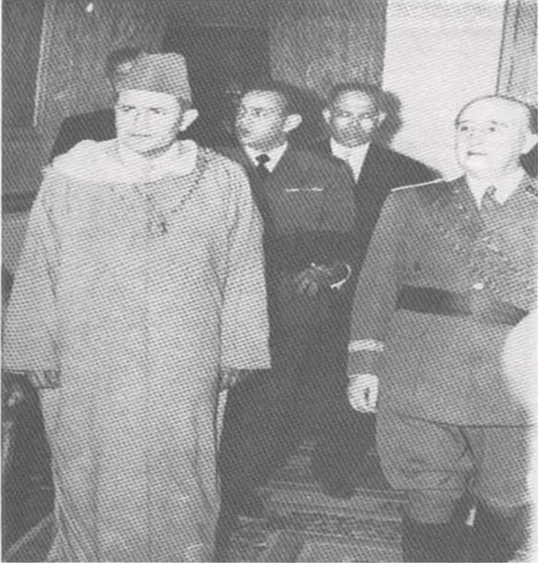
يطل التحرير محمد الخامس رحمه الله رفقة الجنرال فرانكو بمغريد

المريني عبد الحق ، الجيش المغربي عبر التاريخ، الدار القومية للطباعة والنشر، القاهرة، ص 360