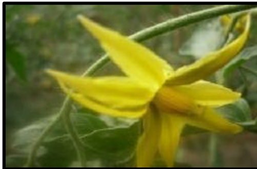
Figure 1.4: Fleur de tomate ( Chougar, 2011 )

Les fleurs de la tomate sont actinomorphes, de couleur jaune et réunies en inflorescences pentamères. Le gynécée possède entre 2 et 5 carpelles ( Abbeyes et al.,1963 ). Le calice compte cinq sépales ou plus, de couleur verte. La corolle compte autant de pétales que de sépales, soudés à la base. L'androcée compte cinq étamines ou plus, à déhiscence latérales, introrse. Les anthères sont allongées et forment un cône resserrée autour du pistil. Ce dernier est constitué de plusieurs carpelles soudés formant un ovaire supère biloculaire ou multiloculaire et à placentation centrale ( Welty et al., 2007 ). Selon le cultivar et les conditions environnementales, le style peut être en position interne dans le cône d'étamine (fleurs brévistyle), affleurant, ou dépassant comme affleurant légèrement (fleurlong style) (figure 1.4).