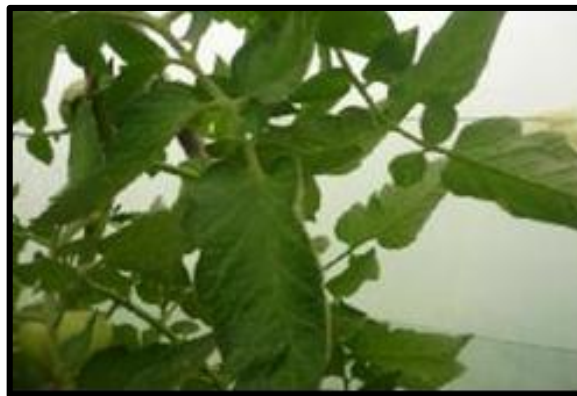
Figure 1.3: Feuille de tomate (Chougar , 2011).

Clitment (1981) , montrent que les feuilles de la tomate présentent une longueur de 10 à 25 cm. Composés de plusieurs folioles principales et intercalaires, à l'aisselle des feuilles se développent les bourgeons (figure 1.3).Les feuilles sont alternes, simples, et sans stipules. Elles sont imparipennées ( Abbeyes et al.,1963 ).