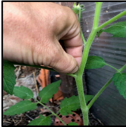
Figure 1.2: La tige de tomate

n'y a qu'une tige par pied. Mais cette tige peut se ramifier et donner à la plante un aspect buissonnant (figure 1.2).