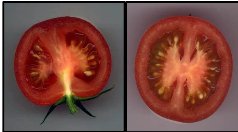
Figure 1.5: Section transversale et longitudinale d'un fruit de tomate (Chougar, 2011).