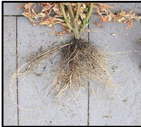
Figure 1.1: Système racinaire de la tomate ( Chaux et Foury, 1994 )

La tomate présente un important système racinaire très ramifié et à tendance fasciculé. Il est très actif sur les 30 à 40 premiers centimètres. De nombreuses racines primaires, secondaires et tertiaires prennent naissance sur un pivot puissant (figure 1.2). Les racines peuvent atteindre une longueur de 85 à 90 cm en sol profond ( Chaux et Foury, 1994 ).