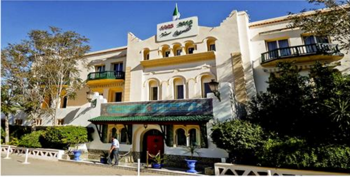
الصورة 5: واجهة فندق كراداة المصنف 4 نجوم ببوسعادة.