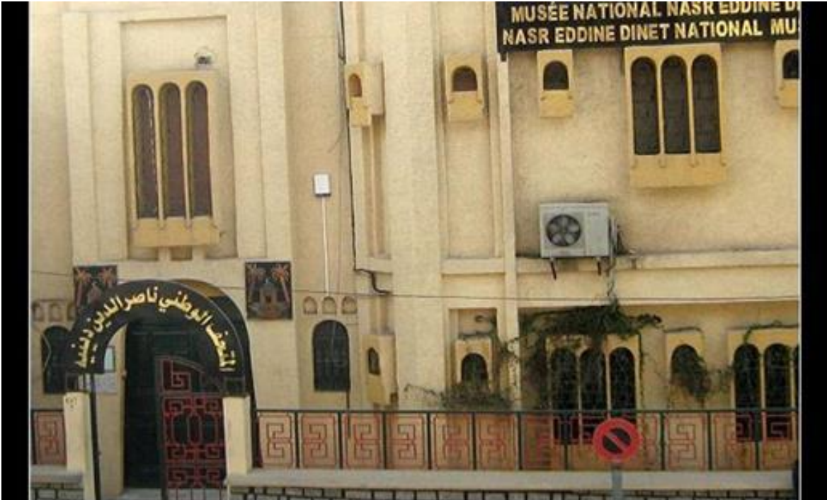
الصورة 4: تمثل المتحف الوطني نصر الدين ديني ببوسعادة