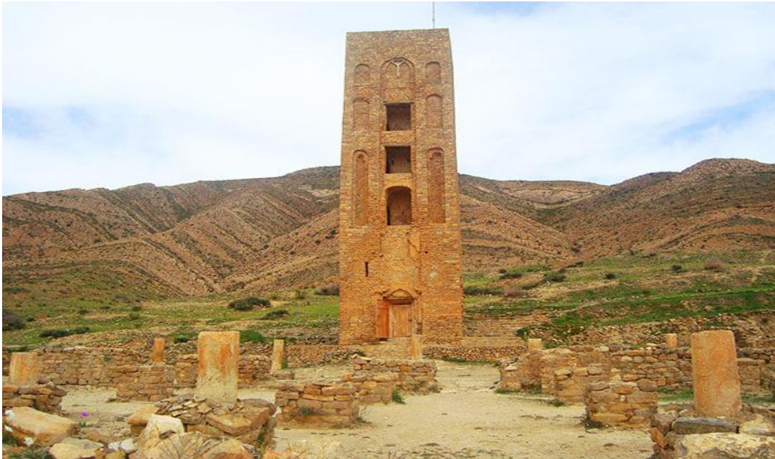
الصورة 2: الموقع الأثري قلعة بني حماد