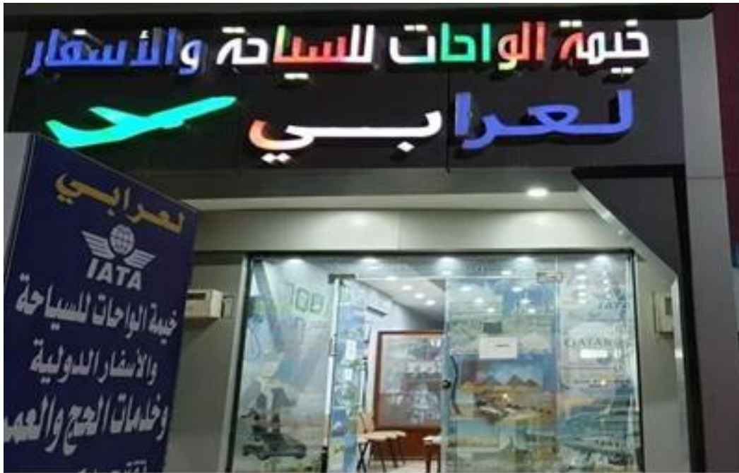
الصورة 6: واجهة مقر ومكتب وكالة خيمة الواحات للسياحة والأسفار