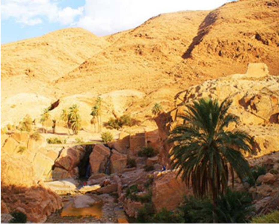
صورة 3: تمثل مطحنة فيريرو من رموز مديمة بوسعادة