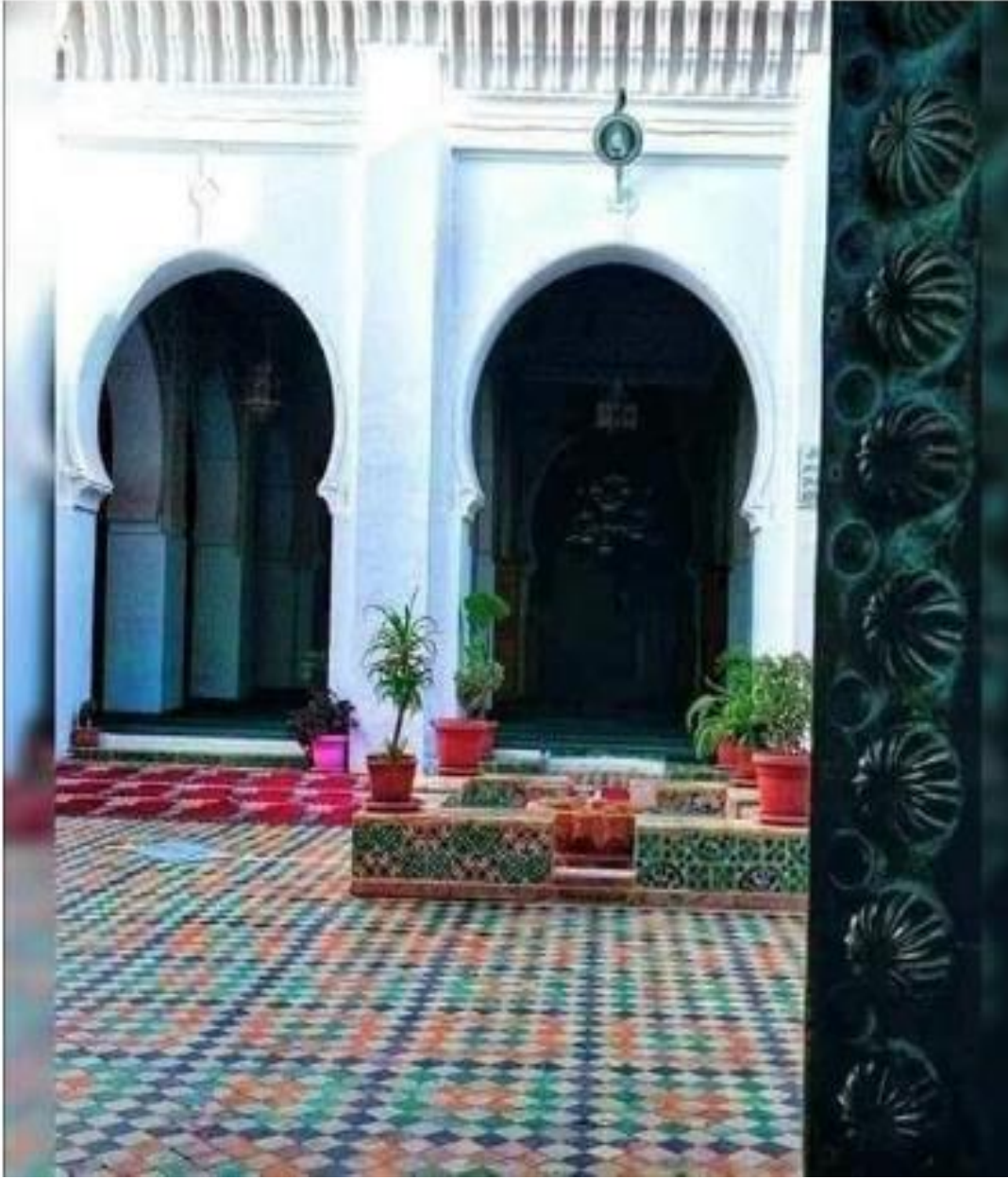
الملاحق رقم 3 : مدرسة سيدي أبي مدين شعيب