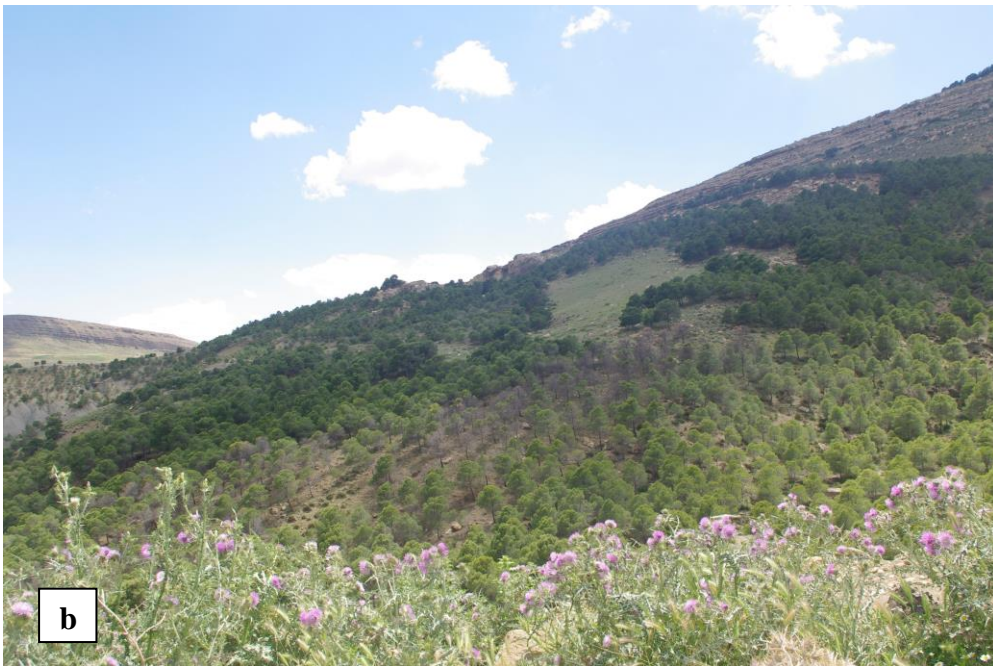
Figure 1 (a, b). Vue générale de la végétation de la région de Maadid