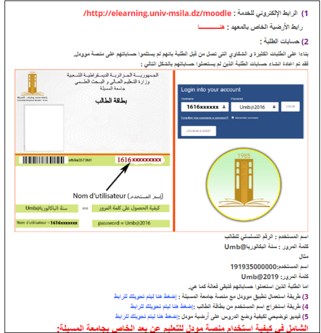
شكل (03) يوضح صفحة موودل قبل الولوج للمنصة