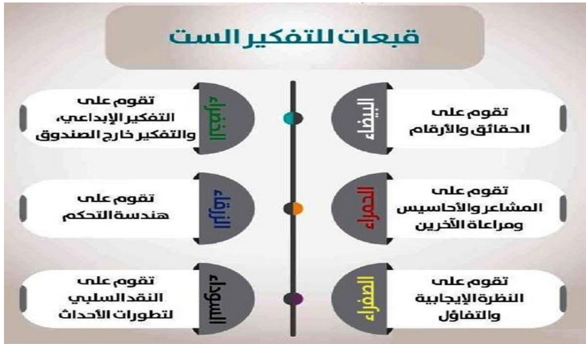
شكل رقم 2 : القبعات الست للتفكير