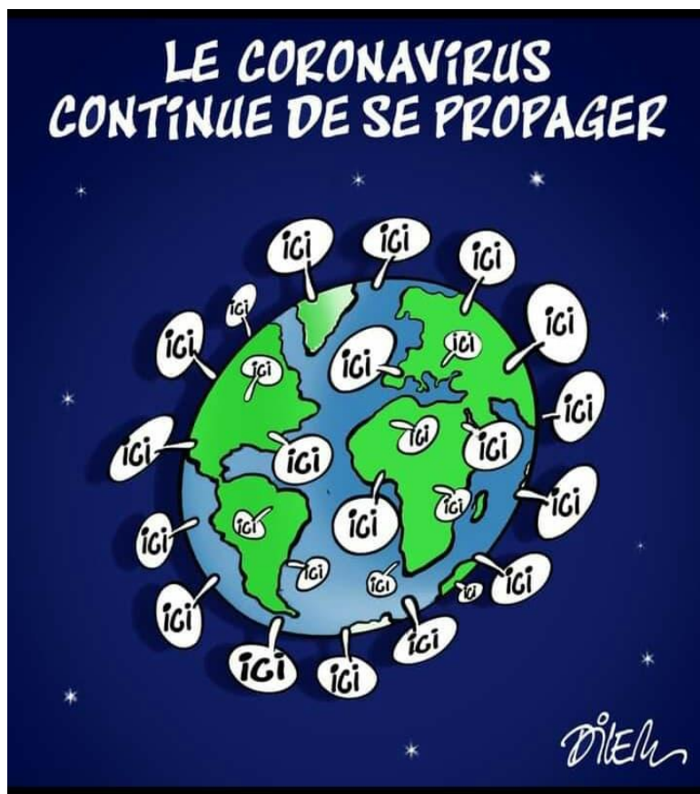
Caricature n° 02 : du Dilem le 16 mars 2020

Cette caricature est parue le 16 mars 2021 sous le titre « Le corona virus continue de se propager », écrit en majuscule avec du blanc sur un fond bleu foncé. Elle est dessinée dans un cadre rectangulaire horizontal dans un plan moyen et signée en bas à droite par Dilem.