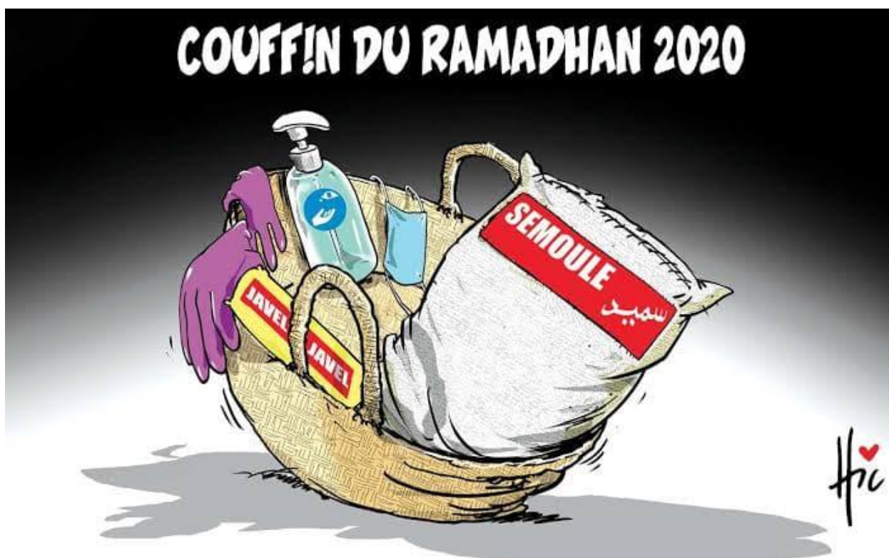
Caricature 0 05: du Hic le 20 avril 2020

La couleur noire de l'arrière-plan semble nous indiquer la crainte et la peur de ce virus.