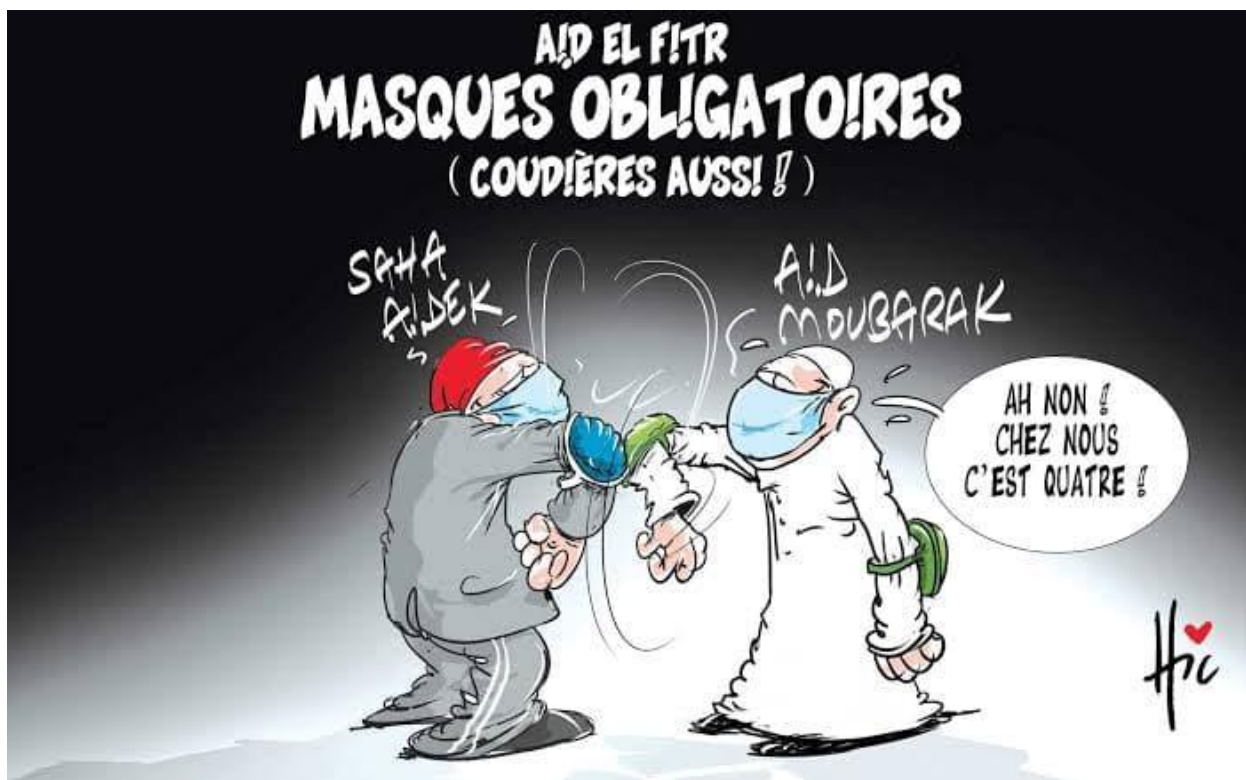
Caricature n° 06 : du Hic le 20 mai 2020

L'arrière-plan de ce dessin est en noir ; la couleur noir dénote la crainte et la peur de ce virus.