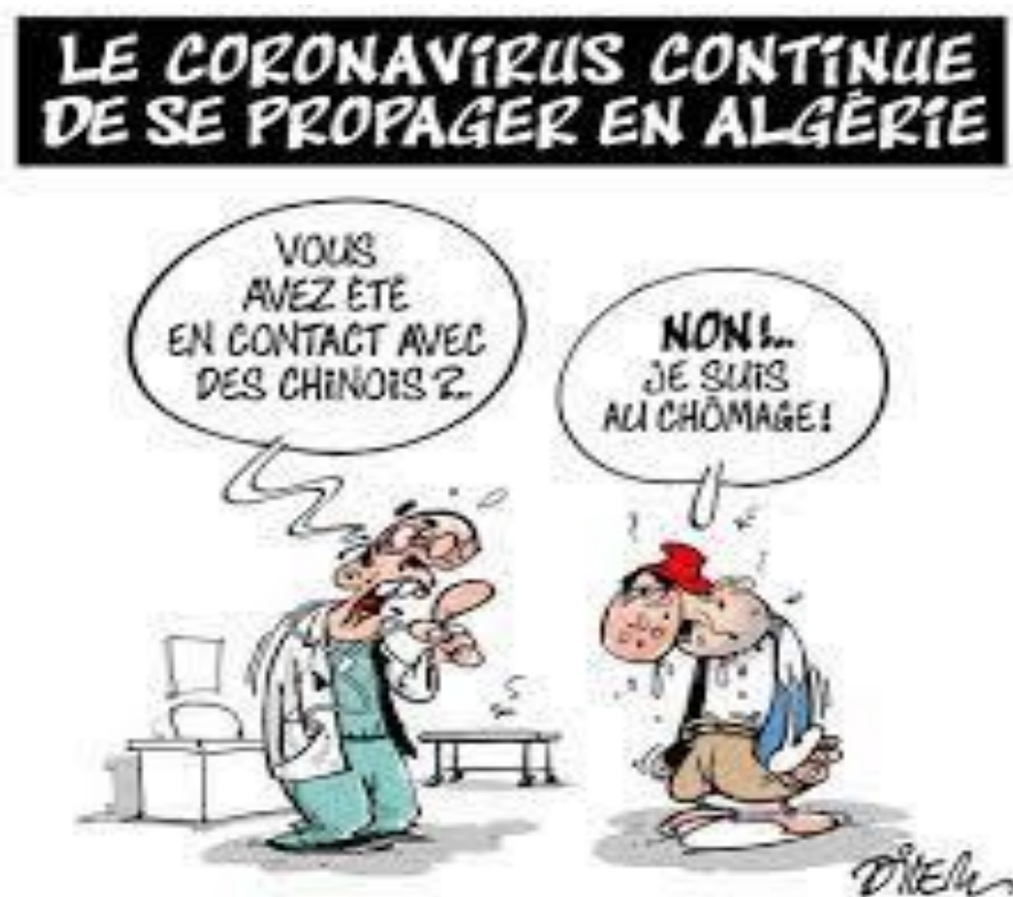
Caricature n° 01 : du Dilem le 27 janvier 2021

Cette image caricaturale intitulé « le corona virus continue de se propager en Algérie », écrit en gras noir sur un fond blanc et des lettres en majuscule. Elle est parue le 04 mars 2020, présenté dans un cadre rectangulaire horizontal, dans un plan moyen et signé par Dilem en bas à droite.