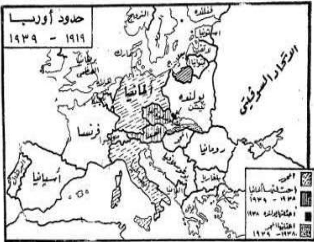
أوروبا بين الحربين