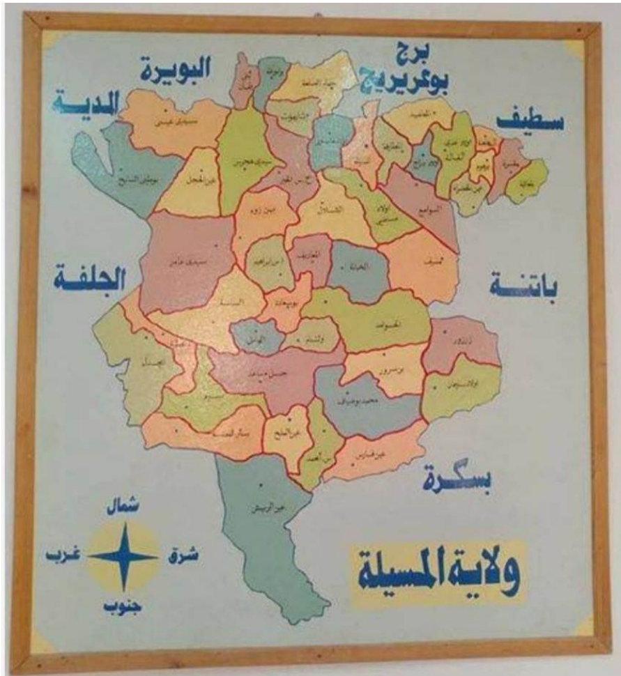
خريطة ولاية المسيلة