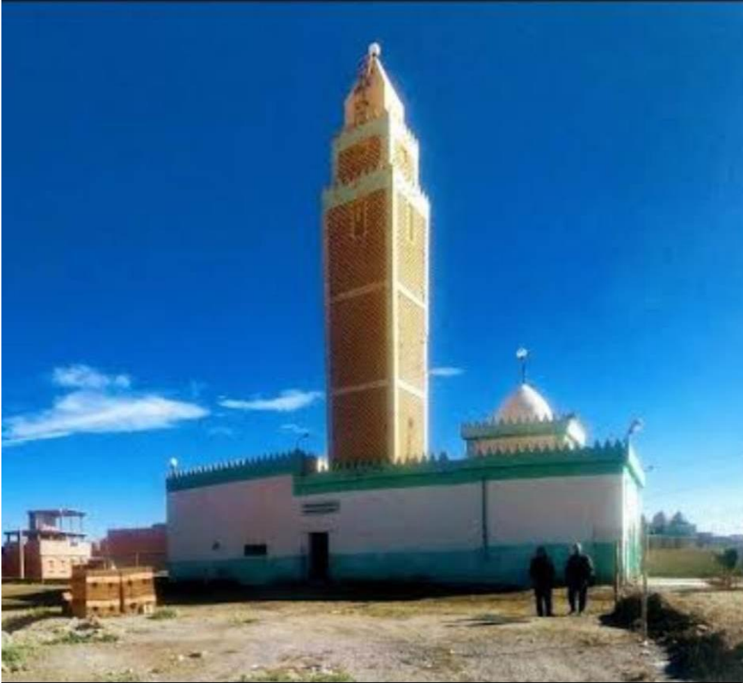
مسجد وزاوية بوجملين بالمسيطة