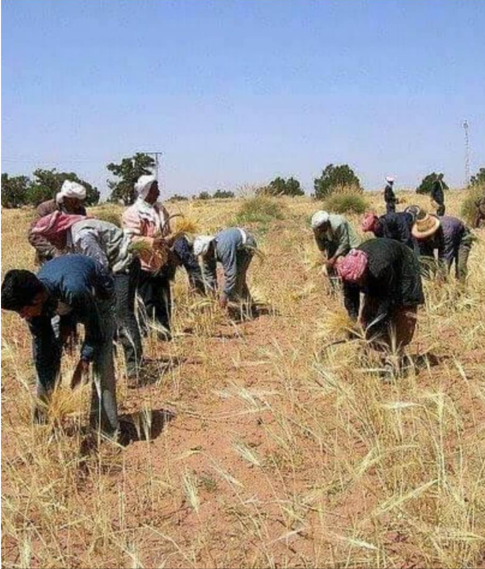
التويذة في منطقة الحضنة