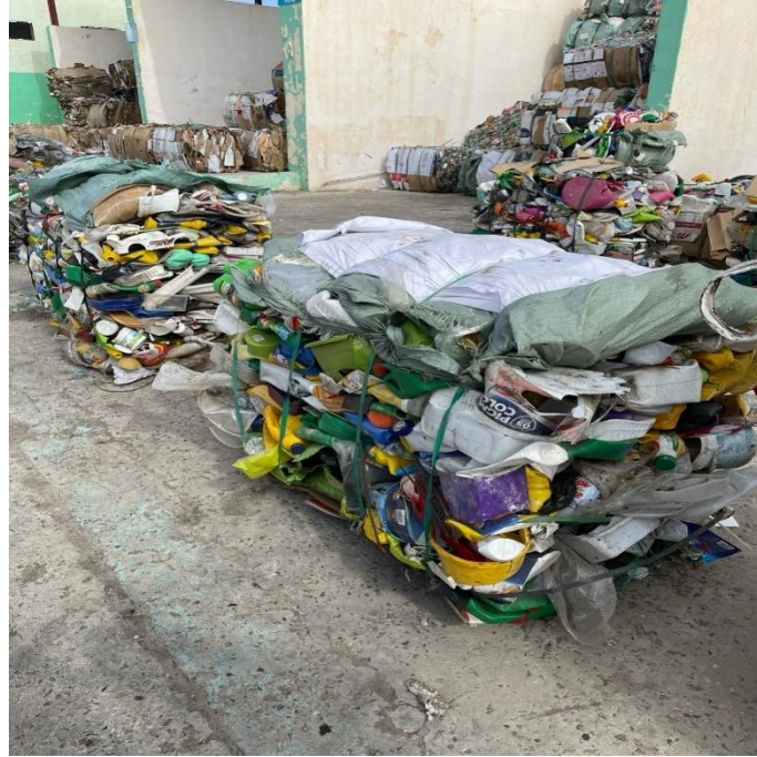
صورة مجموعة من حاويات المخلفات البلاستيكية