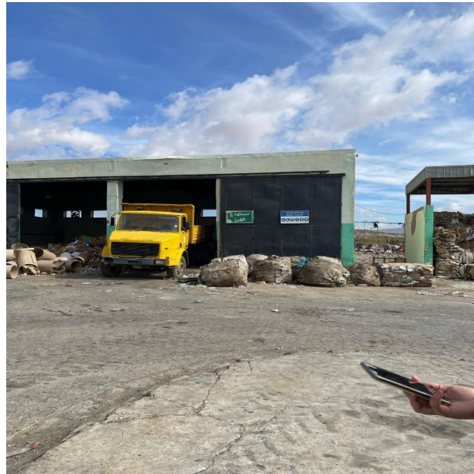
صورة مستودع الفرز