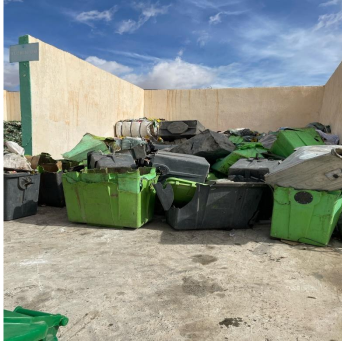
صور حاويات القمامة التالفة