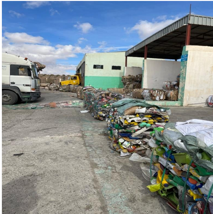
صورة حاويات البلاستيك