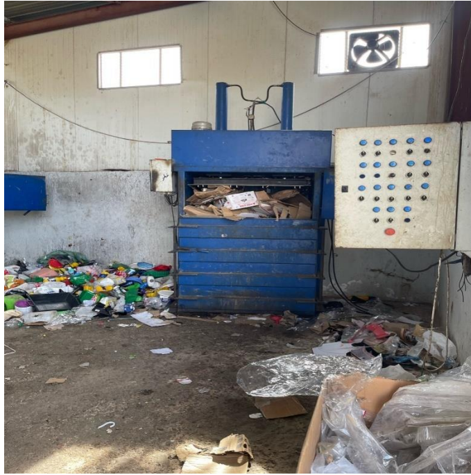
صورة آلة الرص الكهربائية