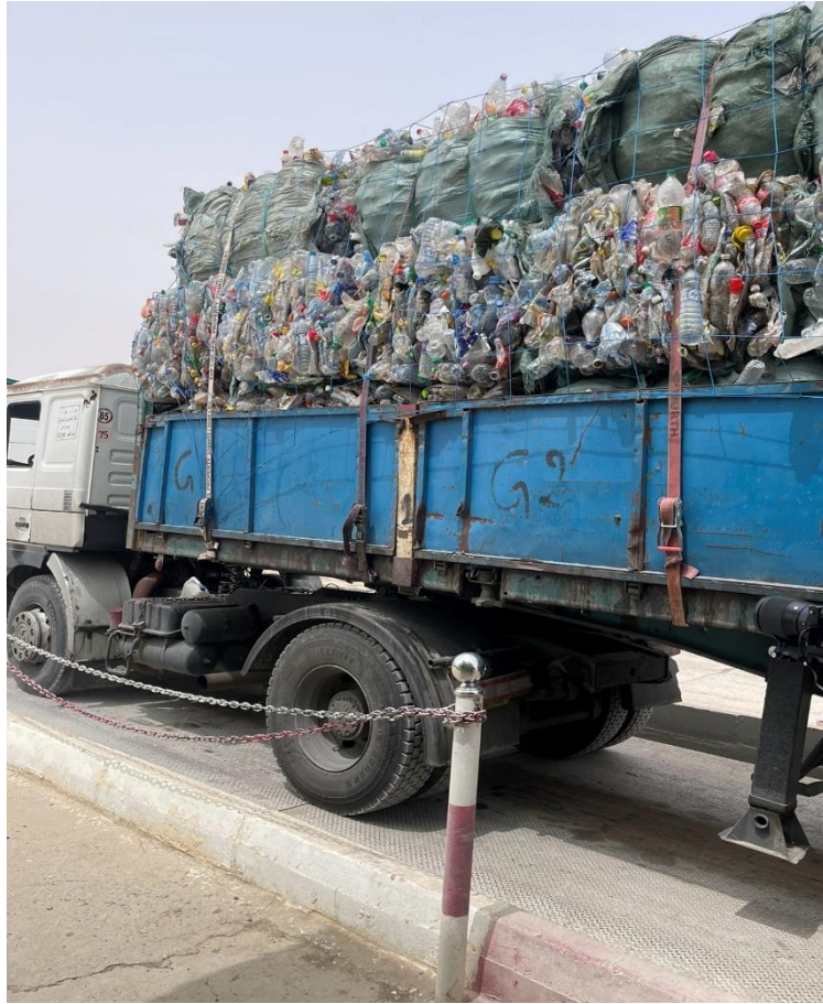
صورة خروج الشاحنة محملة بالبلاستيك المتوجهة إلى شركة خاصة قامت بعملية شراء مع مركز الردم التقني ولاية المسيلة