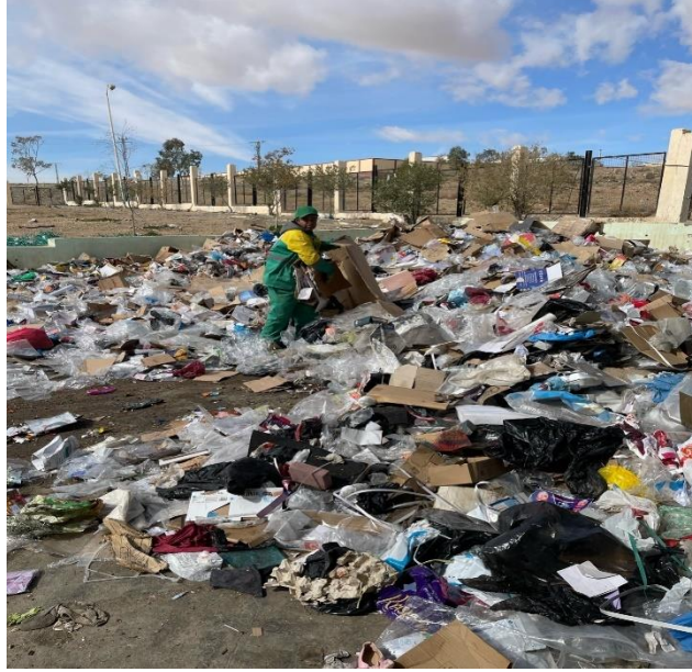
صورة عامل المركز يقوم بفرز النفايات البلاستيك