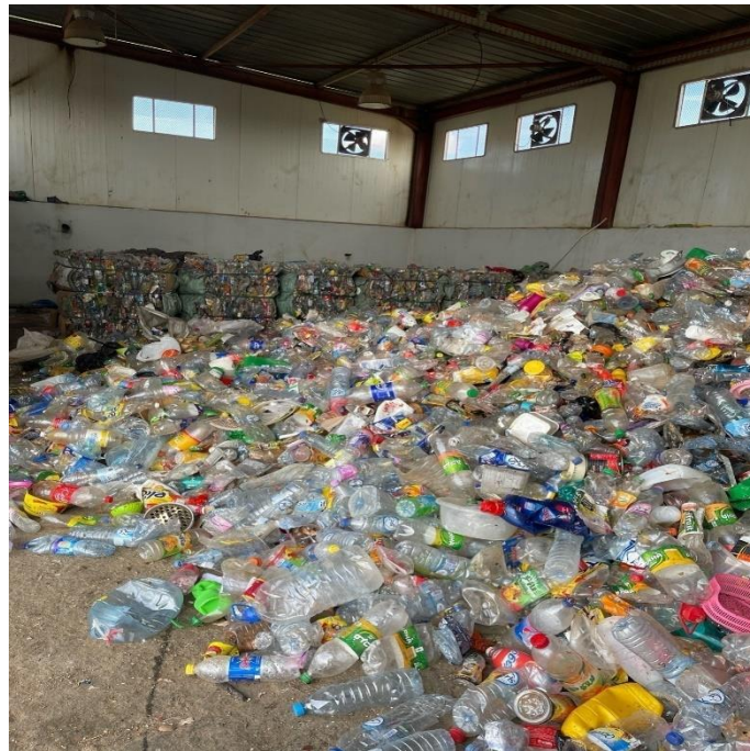
صورة القارورات البلاستيكية في مستودع الفرز