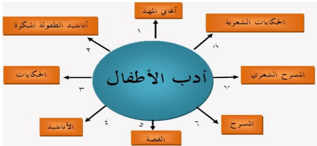
صورة رقم (01) 1

تمثل الصورة المرفقة أهم الأنواع الأدبية التي عرفها أدب الطفل عبر تاريخه، والملاحظ في هذا الوثيقة أن أغاني المهد وأناشيد الطفولة المبكرة دخلتا في دائرة أدب الأطفال. وليس هذا بغريب لأن هذين النوعين اعتبرا من أهم إرثاصات الكتابة للطفل.