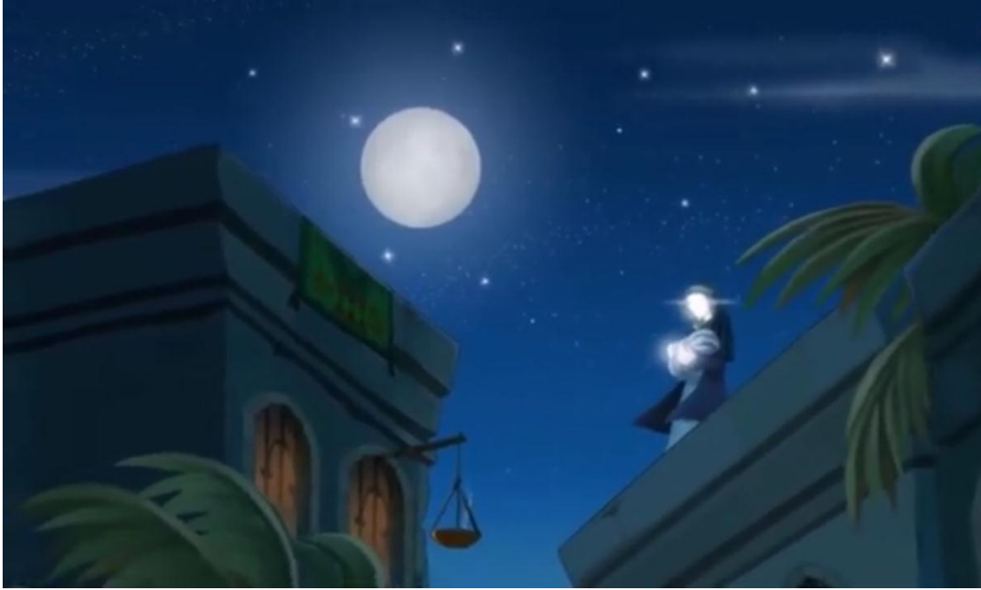
صورة رقم (05) 2

دمعت عيناها وهي تنظر إلى السماء تتساءل إلى متى ستبقى تدعو في زوجها وتحديثه كأنه معها وتدعوه للنظر لجمال وجهه الذي يملأه النور، يا عبد الله أشعر أن هذا الطفل وتخبره بشعورها بأن يكون لهذا الطفل شأن عظيم، وأنه ليس كغيره من الأطفال 1 .