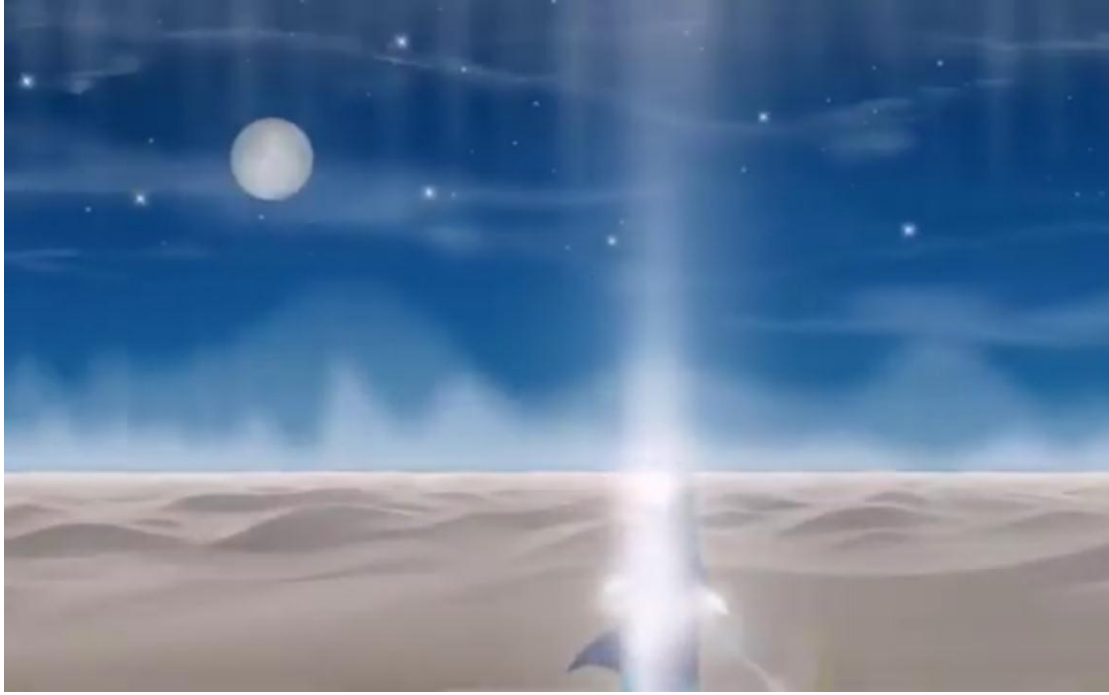
الصورة رقم (06): مشهد تمثيلي لتقابل الأرض والسماء 1

يشوبه النقص ولا تتلاعب به الأسئلة، إنه الوسيلة التي تمنح الطفل معايشة الحدث ومجالسة الشخصيات يحاورها وكأنه جزء من الرواية أو يراها جزءا منه تكمل من نقص لديه من معرفة وخبرة.