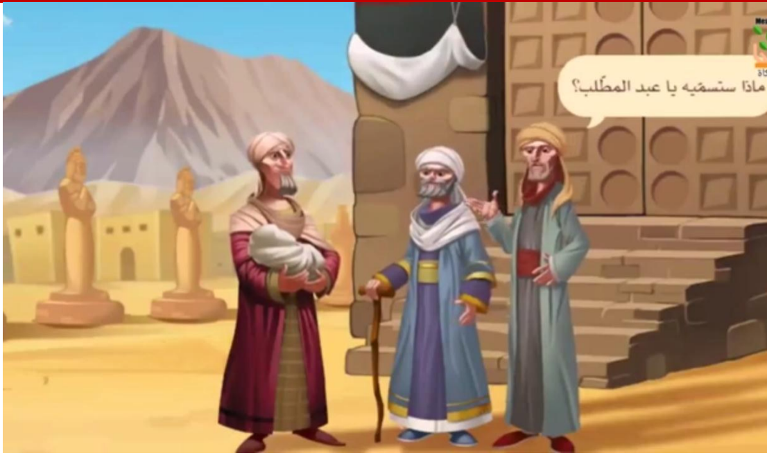
صورة رقم (07): مشهد تمثيلي لميلاد النبوة 1

فعندما يرى الطفل هذا الموقف المهيّب، وصورة النور يخرج من بين الصخور يدرك ان هذه المعجزة إلهية خص بها نبينا الحبيب (ص)، فهذا المشهد يثير في ذهن الطفل تساؤل: هل يعني ذلك أن مولد الرسول وطفولته كانت تشير إلى أنه سيكون له شأن؟ ويدرك العبرة في أن الرسول (ص) قد اصطفاه الله من بين خلقه ليكون هاديا للبشرية، فأختار له اسمه، وعصمه من الخطأ إذ انتزع من قلبه حظ الشيطان، فتفاعلية الطفل قد تمثلها حاجته لأن يرى أمامه في القصة شخصية حية مجسمة، وأن يسمعها تتكلم بصدق وحرارة وإخلاص، حتى يرى فيها النموذج الذي يحتذيه 2 .