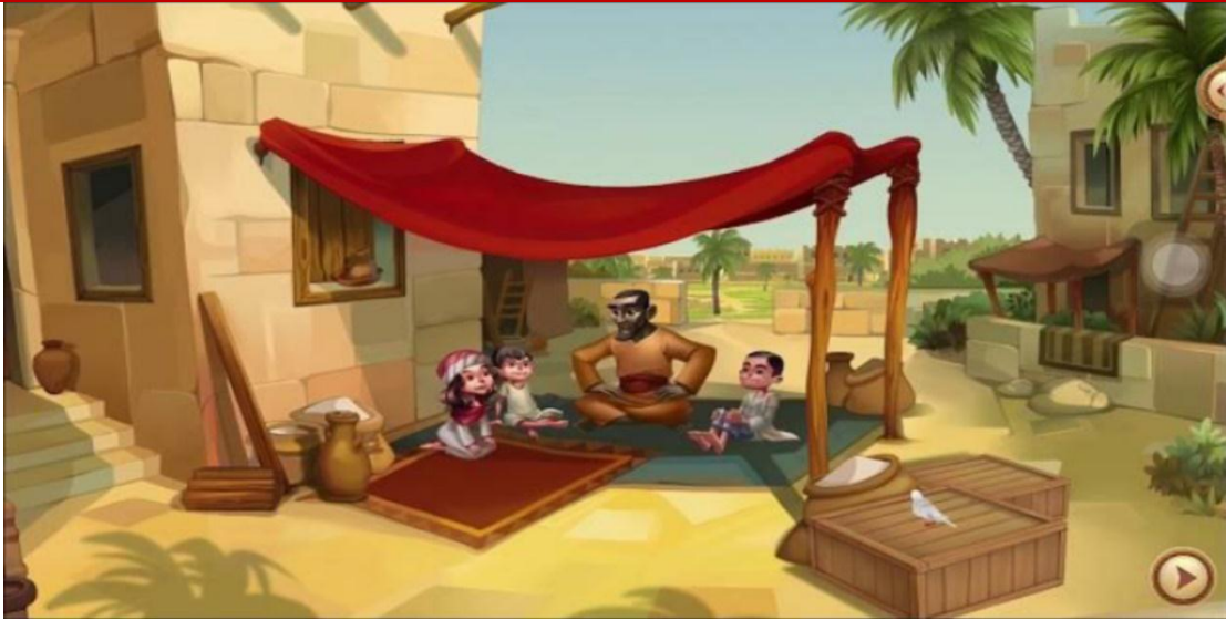
صورة رقم (02) 1 : مشهد المجالسة

تحليل الصورة المشهدية إدراك الطفل على حكايات الجدة في البيت فالمشهد يعطي صورة الحاكي (الراوي) وكيف يشد انتباه المتلقين من الأطفال، وعملية التلقي هنا بصرية وليست سمعية إذ تساعد على دمج الطفل المتلقي خارج المشهد مع الحكاية، وقد وفر المؤلف تأنيثاً للمشهد من خلال منظر الأطفال محيطة بالراوي وما يصاحب هذا المشهد من أواني وأفرشة وغيرها من التأنيث. وهذه لصورة بظلالها اللونية الباهتة توفر عناصر السكون والتأمل تمام كما تعكس عملية الحكاية في واقع الطفل في أسرته.