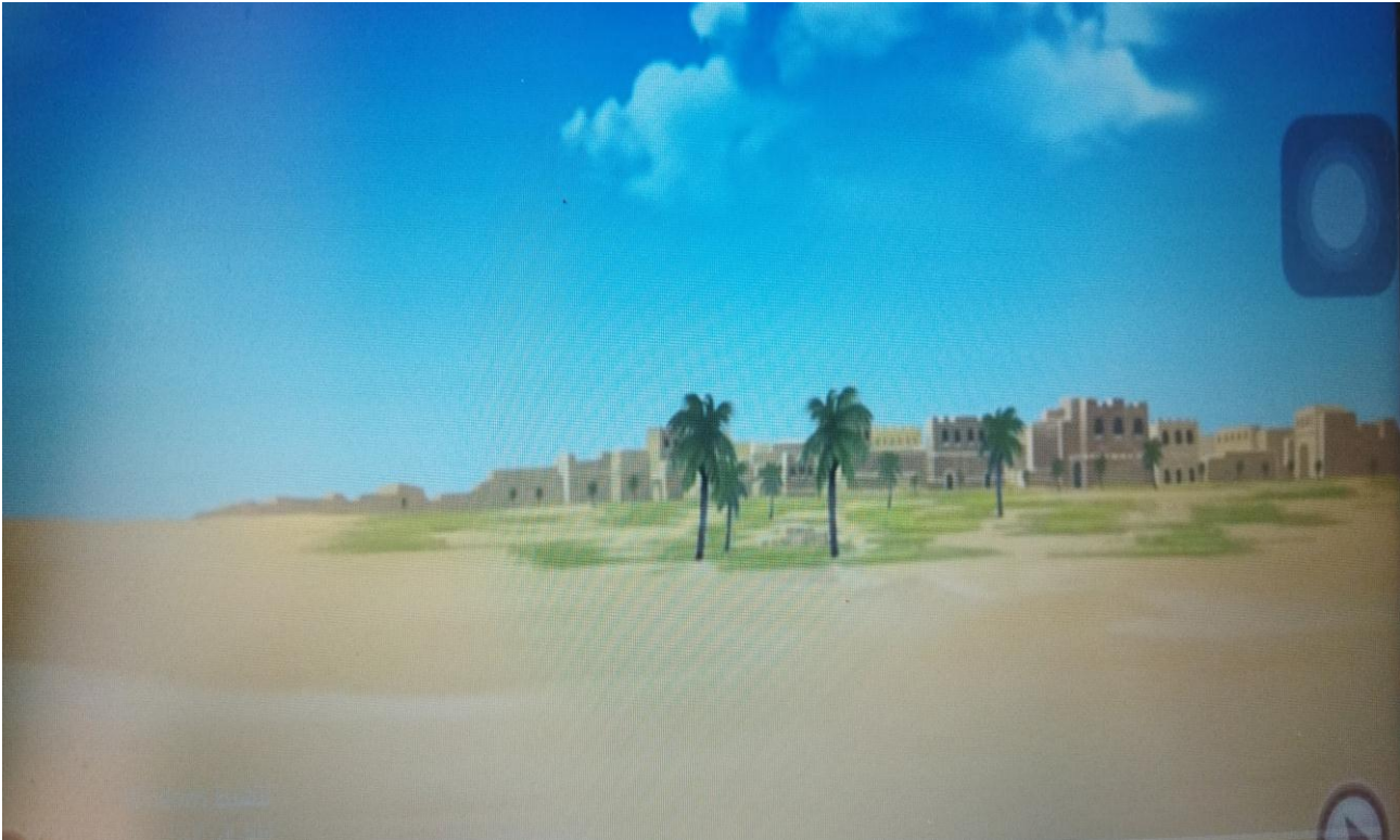
صورة رقم (03): الفضاء المكاني والزمني