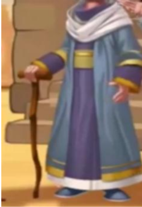
صورة رقم (10): سيمائية اللباس

من العناصر التي لم يحرص القرآن على الاهتمام بذكر، وبذلك يجتهد فريق العمل في هذا النص التمثيلي التفاعلي لتجسيد صورة شخصياته، انطلاقاً بالاستعانة بكتب التاريخ وبالاجتهاد في تصور اللباس في تلك الآونة.