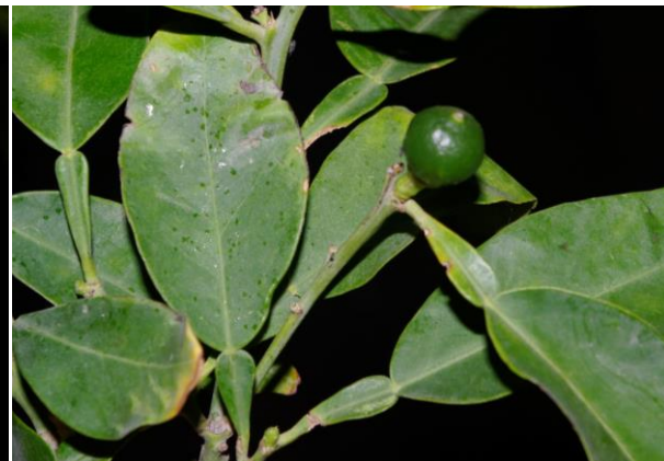
Citrus x limon