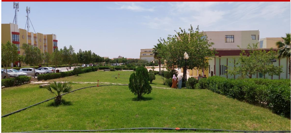
Figure 3. Vue générale des espaces verts de l'université de M'sila (Pôle 2)