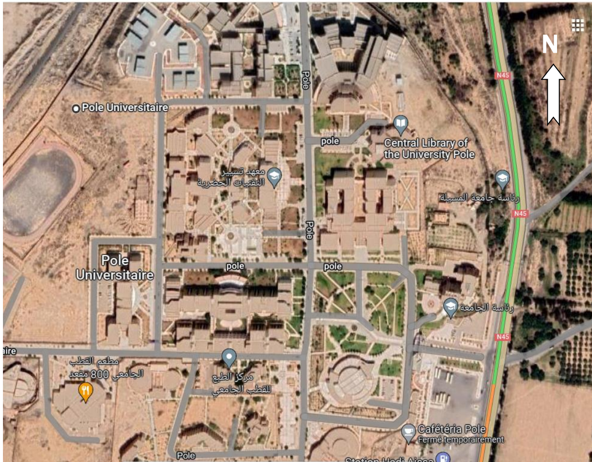
Figure 2. Vue générale des espaces verts de l'université M. B. de M'sila (Pôle 2) ( https://www.google.com/maps/ )