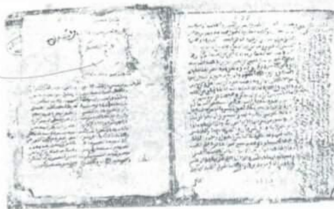
الصفحة الأخيرة من رحلة ابن حمادوش