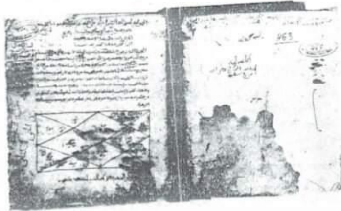
الصفحة الأولى من رحلة ابن حمادوش