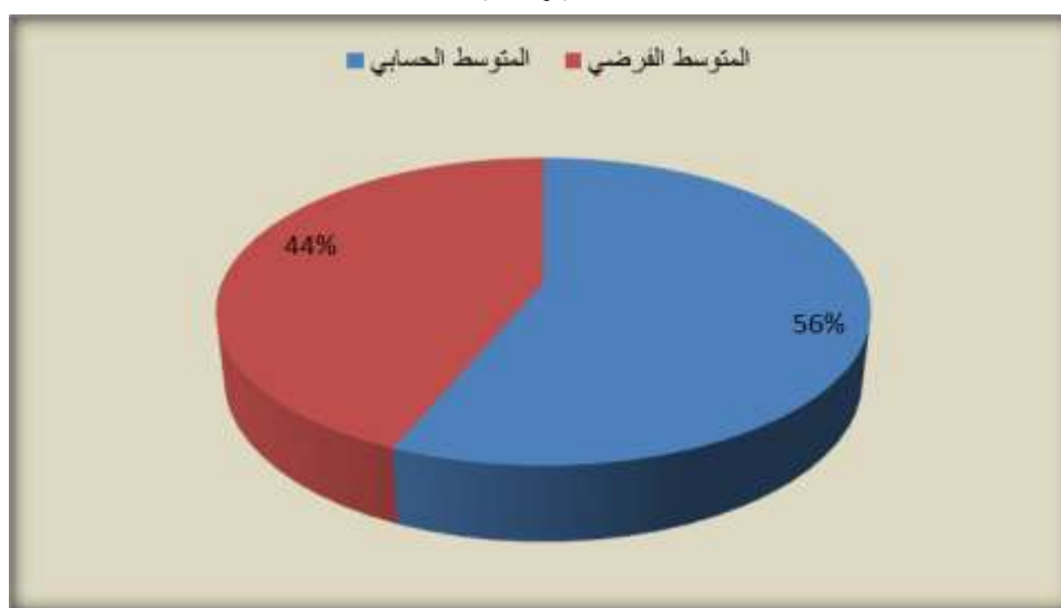
الشكل رقم(01): يمثل الفرق بين المتوسط الحسابي لأفراد عينة الدراسة والمتوسط الفرضي على المحور الأول

من خلال النتائج المبينة بالجدول رقم (04) والشكل رقم (01) أعلاه نلاحظ وبناء على المتوسط الحسابي لأفراد عينة الدراسة على المحور الأول والذي بلغ 25.80 أنه أعلى من المتوسط الفرضي والمقدر بـ 20 بناء عليه فإن للنشاط البدني الرياضي التربوي دور في تعديل السلوك الانفعالي لدى تلاميذ المرحلة الابتدائية ، وهذا ما أكدته قيمة "ت" بالنسبة للعينة الواحدة التي بلغت قيمتها 20.53 وهي قيمة موجبة "أي أن الفروق لصالح المتوسط الحسابي لأفراد عينة الدراسة" ودالة إحصائياً عند مستوى الدلالة ( \alpha=0.05 )، ومنه تم قبول فرضية الدراسة القائلة بـ " للنشاط البدني الرياضي التربوي دور في تعديل السلوك الانفعالي لدى تلاميذ المرحلة الابتدائية "، ونسبة التأكد من هذه النتيجة هي 95% مع احتمال الوقوع في الخطأ بنسبة 5%.