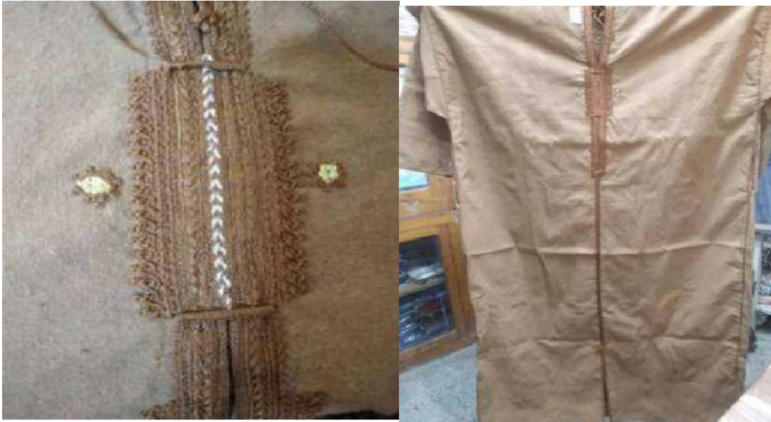
Modèle de broderie sur une Kachabia.

La kachabia est une tunique traditionnelle d'origine berbère qui possède une grande valeur culturelle en Algérie confectionnée en laine ou en coton selon les saisons, elle se caractérise par: