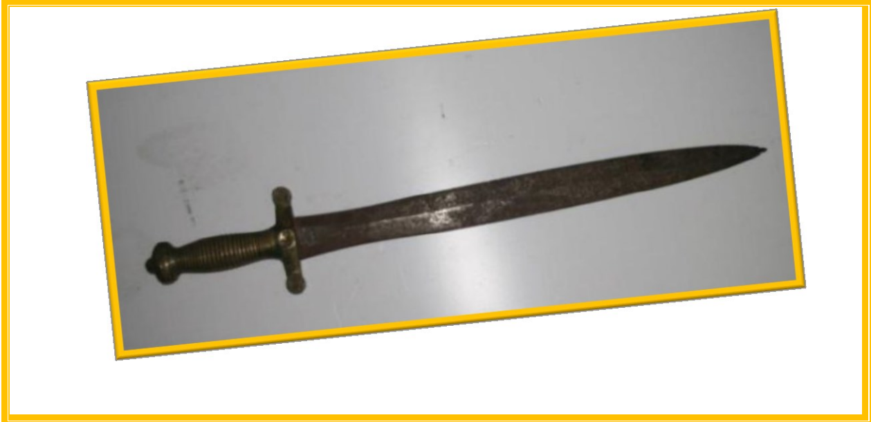
الشكل 03: أنموذج لسيف النمشة

(أنظر : عبد الرؤوف قاصير . عباس كحول، " أسلحة المجندين في الجيش الجزائري خلال العهد العثماني (1519- 1830) " ، مجلة المعارف للبحوث والدراسات التاريخية، جامعة الوادي، مجلد09، العدد 02، 2024، ص 615 )