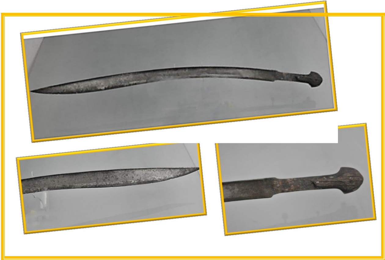
الشكل 01: صور لسيف اليطغان

(أنظر: اهداب محمد حسيني، " نماذج من الأسلحة الخفيفة للجيش العثماني المحفوظة في متحف الكفيل الاسلامي بمدينة كربلاء "نشر ودراسة"، مجلة البحوث و الدراسات الاثرية، العدد02، 2022، ص 320 )