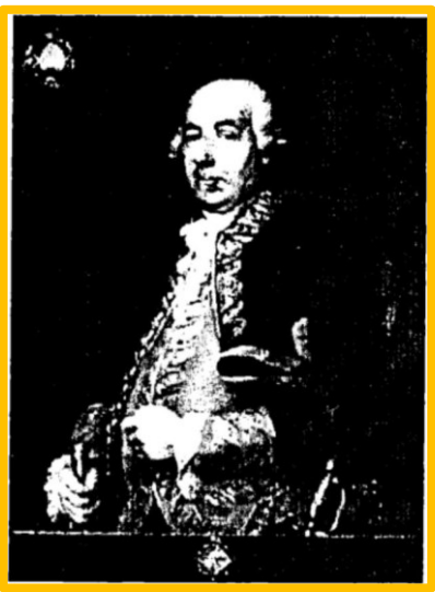
الشكل 7: الدون أنطونيو بارثيلو Don Antonio Bartcelo

( أنظر: نادية فتيسي، المرجع السابق، ص 526 )