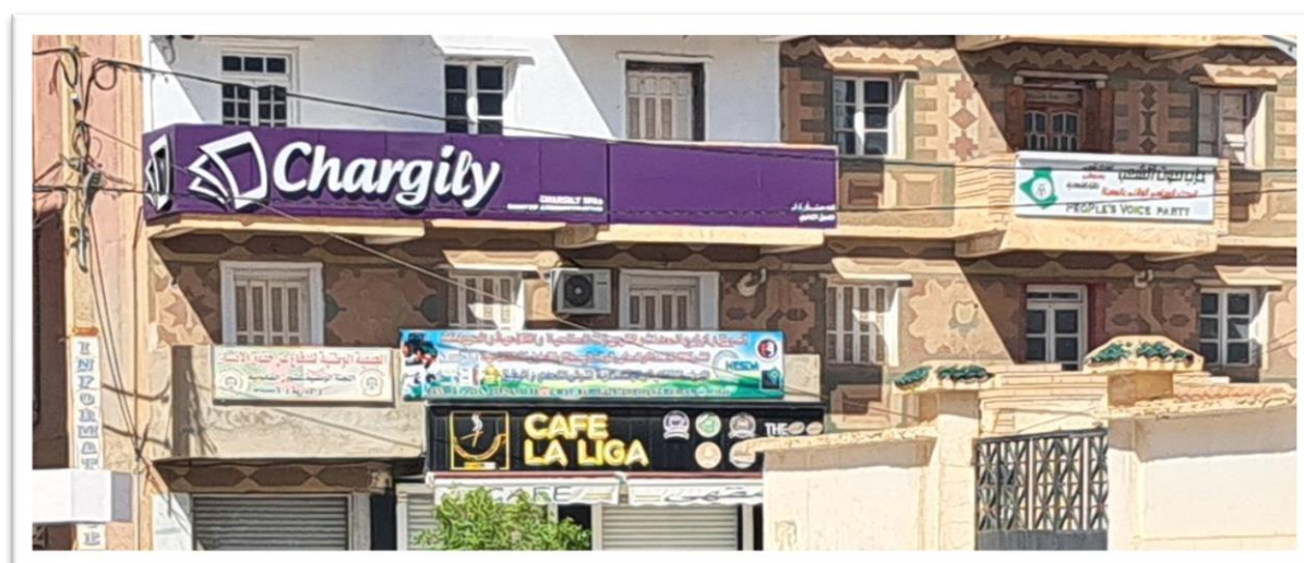
Affiche N° 08