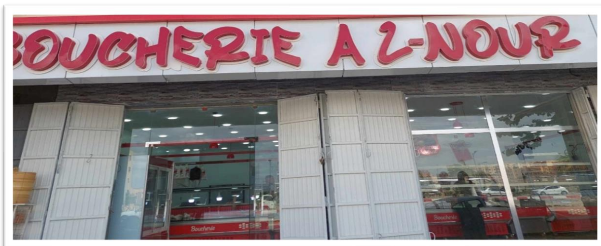
Affiche N° 06