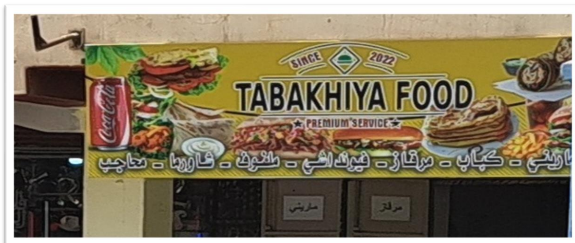
Affiche N° 07