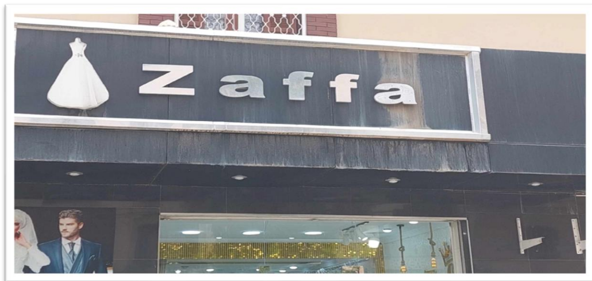
Affiche N° 09