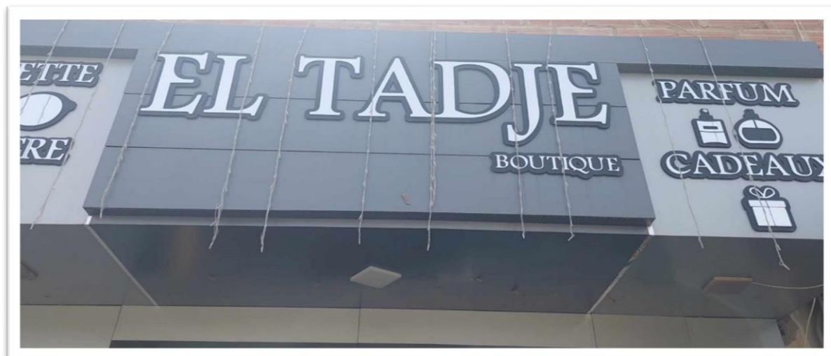
Affiche N° 10