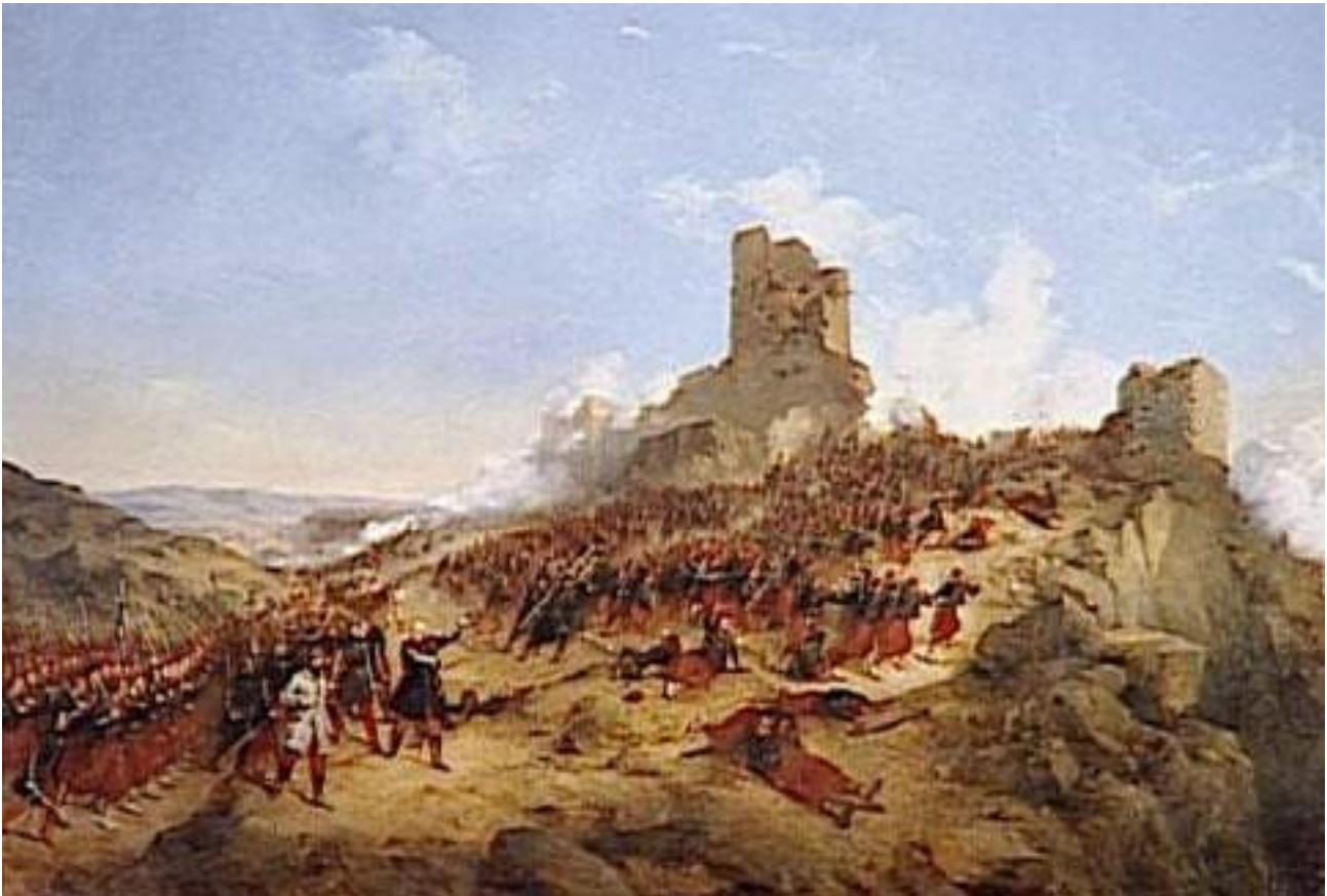
Une peinture de Jean Adolphe Beauce. Sur le site du Ministère de la Culture.

https://www.google.com/url?sa=t&source=web&rct=j&opi=89978449&url=https://www.culture.gouv.fr/&ved=2ahUKEwiX_7Xoj-