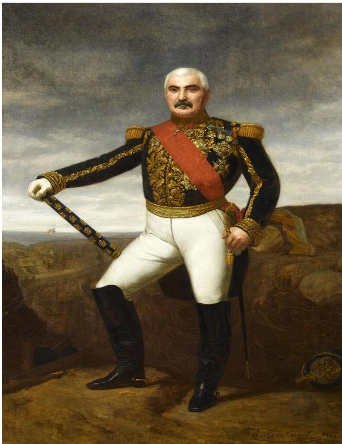
Le maréchal Pélissier, duc de Malakoff. Huile sur toile d'Henryk Rodakowski, 1857.