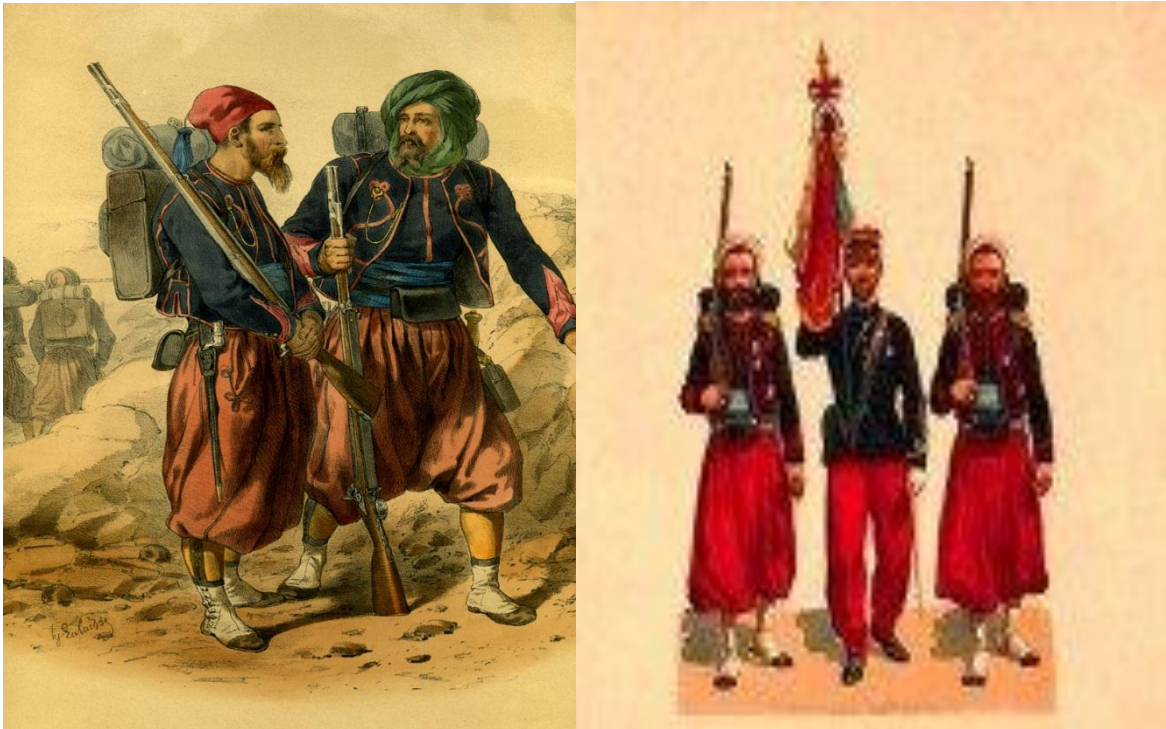
Soldats issus d'unités d'infanterie légères de l'Armée d'Afrique, le 4 décembre 1852 La prise de la ville de Laghouat