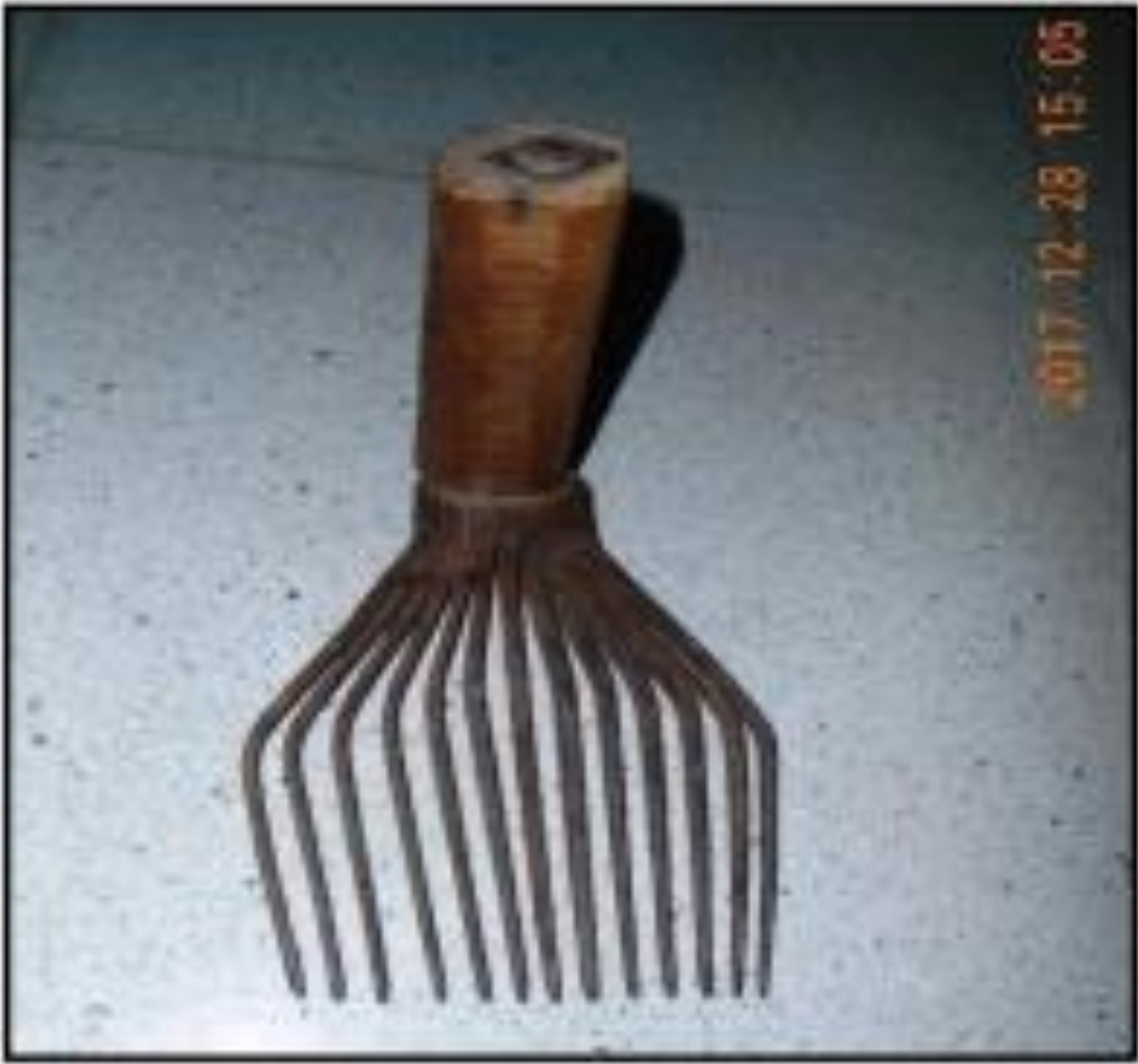
صورة رقم (04): اليازبلا النذير (قوادرية)، المرجع السابق، ص 317