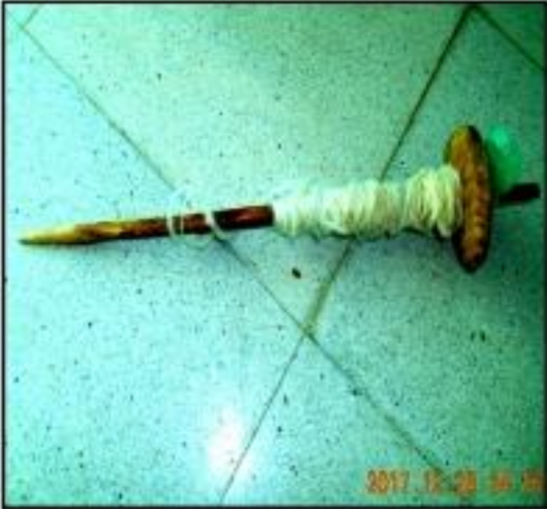
صورة رقم (03): المغزل النذير (قوادري)، المرجع السابق، ص 317