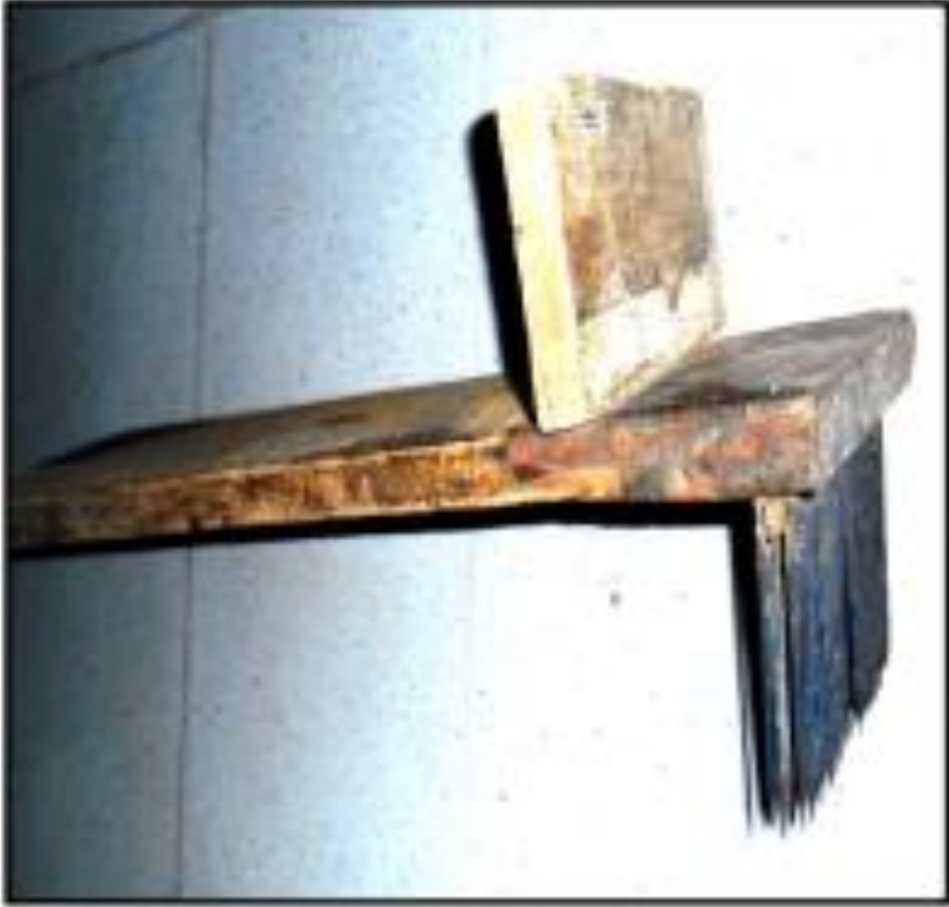
صورة رقم (01): المشط النذير (قوادرية)، المرجع السابق، ص 316