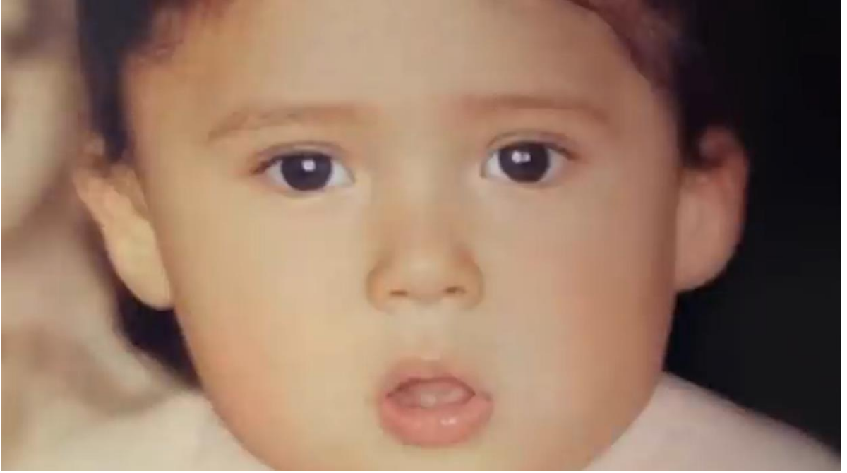
الملحق رقم 02: صورة للإعلامية خديجة بن قنة أيام الطفولة