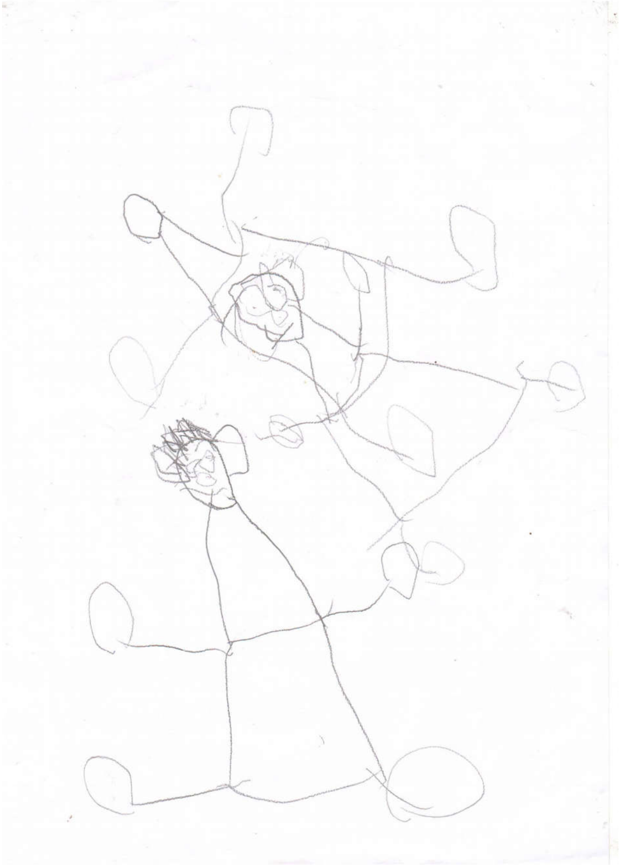
الشكل رقم 02