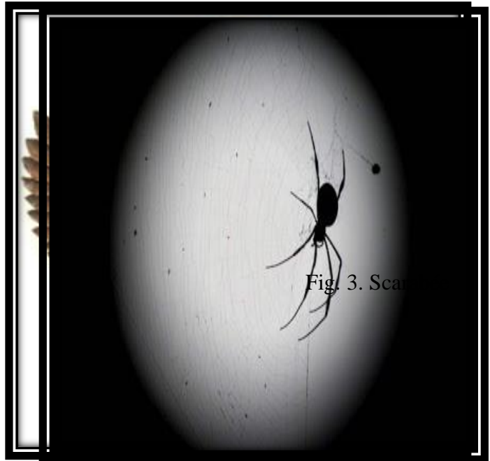
Fig. 3. Scarab

« J'ai déjoué l'hégémonie absolue et il me restait à faire mourir quelques autres : ces monarques qui n'ont même pas la légitimité atavique de ma mère et qui, agglutinés à leurs châteaux du Nord comme des scarabées à une roche-fossile » P32.