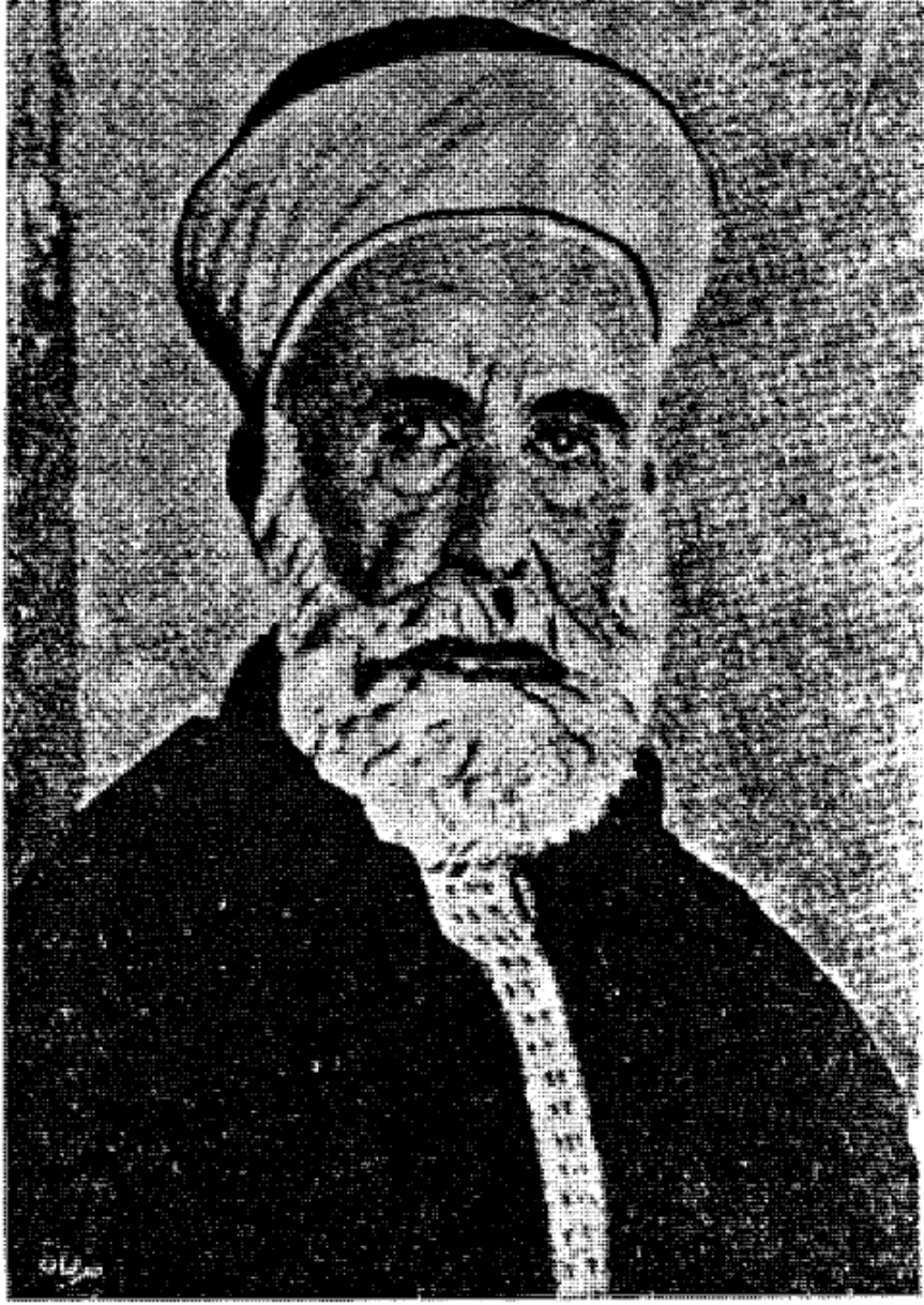
جلالة الملك حسين بن علي