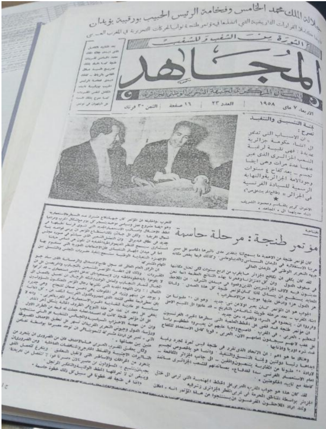
5 جريدة المجاهد ، مؤتمر طنجة مرحلة حاسمة العدد 23، 1958/05/07، ص05