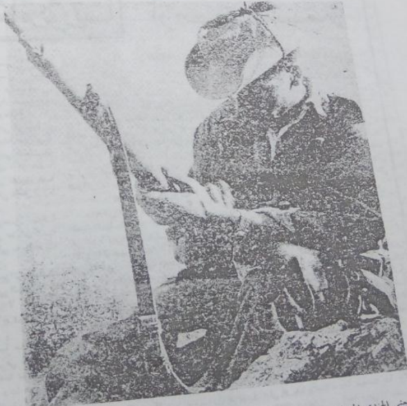
يشي الجندي الجزائري بسلاحه عناية بالغة لانه يؤمن بقيمة السلاح عندما يكون في ايدي ابطال يؤمنون بالنصر .

يقود الشعب الجزائري حرب التحرير الوطني منذ ما يقرب من اربع سنوات . حربنا يذهب ضحيتها مئات الالاف من الشجر الضحايا لنذهب سدى لقد قبرت فكرة « الجزائر الفرنسية » الى الابد ، وانهار الجهاز الاستعماري بأكمله ، ومن خلال الانقراض الاستعمارية تقوم دولة جزائرية تتمتع بجميع خصائص السيادة . والامة الجزائرية في نفس الوقت تستعيد مكانتها داخل مجموعة المغرب العربي ، كما ان الوحدة المغربية بدأت تسترجع حقوقها ، وعاهي الجبهة المغربية تنظم من جديد بعد ندوة طنجة التاريخية التي فتحت لها طريق الوجود العملي الذي يجسم اعرق رغائب شعوب الشمال الافريقي . حقا لقد قطعنا منذ ١٩٥٤ مسافة طويلة ، وفرسا وحدها هي التي بقيت جامدة على سياستها الرجعية لانها عاجزة عن ان تعرف مدى هذا التطور التاريخي الجبار وبعد ندوة طنجة ، تفضل الاخوان كريم بلقاسم ، ومحمود الشريف عضوا لجنة التنسيق والتنفيذ قاديا الى « المجاهد » وعرض عن الوضعية العسكرية والسياسية بالجزائر وان هذه الفقرات التي نقلها من كلامهما تكتسي ولا شك اهمية خاصة بالنسبة لمناضلينا وتبركل من يتتبع باهتمام كفاح الشعب الجزائري ويتساءل عن نوايا جبهة التحرير الوطني .