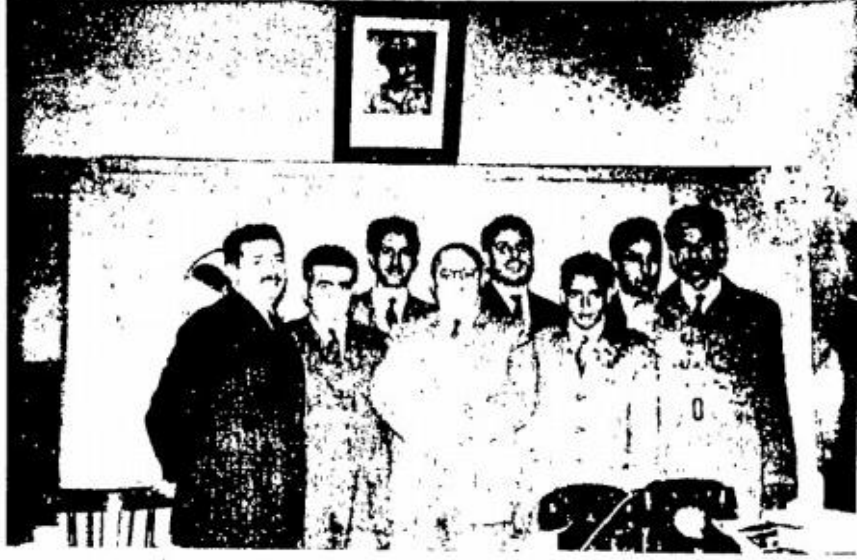
قادة الكفاح بشمال افريقيا خلال اجتماعهم بمكسي يوم ٢٥ فبراير ١٩٥٦ الصف الامامي : طاهر الاسود - بشير الصباح - فتحي الذهب - الدكتور المهدي بن عبيد - عزت سليمان الصف الخلفي : احمد بن بلة - الدكتور عبد الكريم الخطيب - عباس الغرور

الملحق رقم (03) 4 : قادة جيش التحرير يقرر وحدة الكفاح بشمال افريقيا ،اليمن احمد بن بلة طاهر الاسود الدكتور عبد الكريم الخطيب