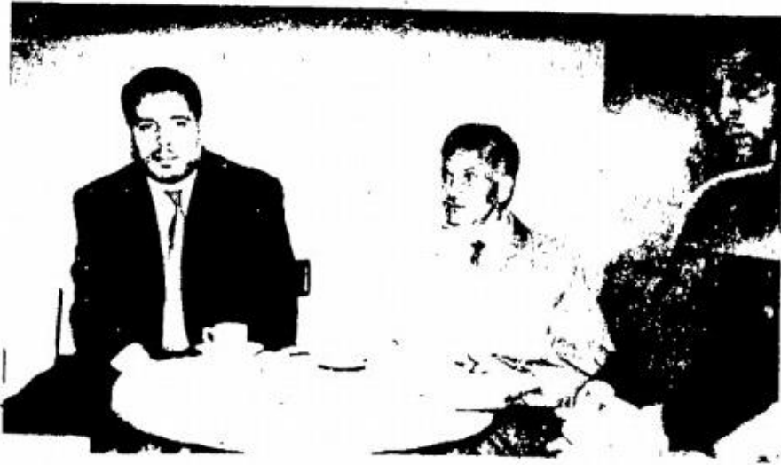
قادة جيوش الصحراء الثلاثة بقرروا وحدة الكفاح المسلح بشمال افريقيا اليمين : احمد بن بلة - طاهر الاسود - دكتور عبد الكريم الخطيب