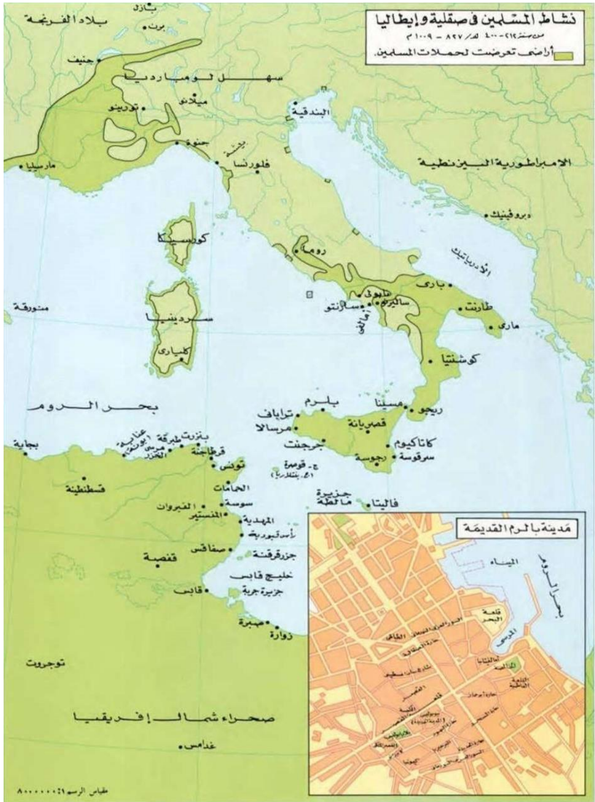
الملحق (2): نشاط المسلمين في صقلية وإيطاليا