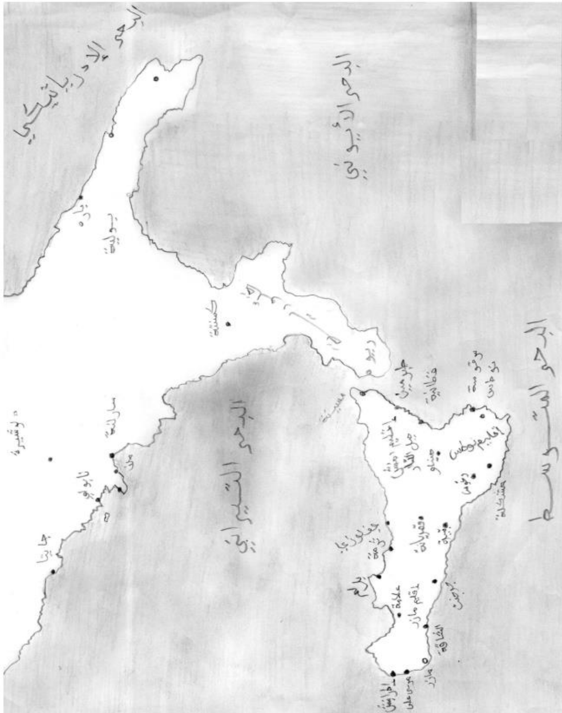
الملحق رقم 01: خريطة صقلية وجنوب إيطاليا

عن كتاب الراجحي عبد السلام، العلاقات السياسية والحضارية بين الدولتين البيزنطية، ص: 215.