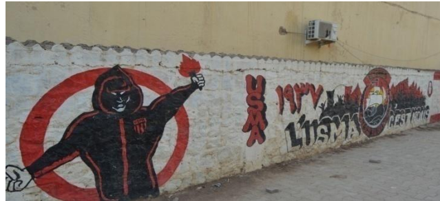
Figure : 25

⇒ Figures N° 26, 27, 28 : présentent les 05 grands créateur du football de la ville de Sidi Aïssa avec l'expressions suivante: حتى لا ننسى تاريخنا الرياضي = pour ne pas oublier notre histoire sportif. C'est un tableau qui fait passer un message aux générations prochaines sur l'histoire sportive de leur ville. Le dessin est associé avec un mur qui porte le logo de l'équipe IRBSA qui porte le blanc et le rouge avec une expression de remerciements par les jeunes de cette ville au créateur.