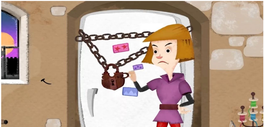
Moment 3: la scène du géant avec le petit tailleur.