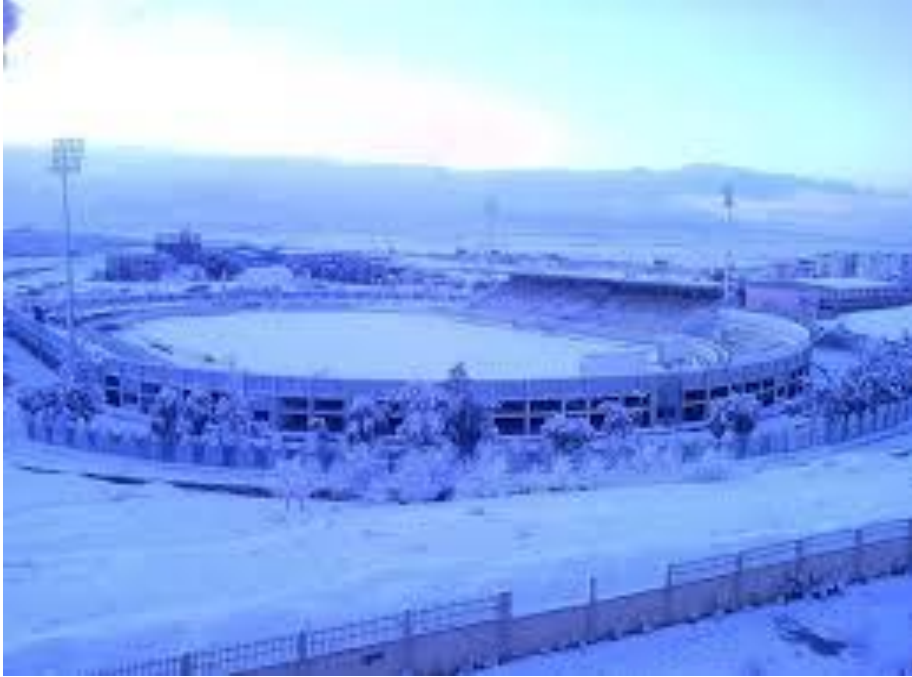
ملعب 20 اوت 1954