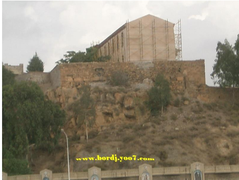
المعلم التاريخي برج المقراني

راجع أوكيبيديا الموسوعة الحرة عن مدينته خنشلة ثم مدينة سطيف لتعرف أصل القصة