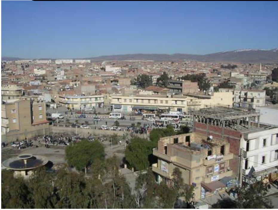
مدينة برج بوعريش