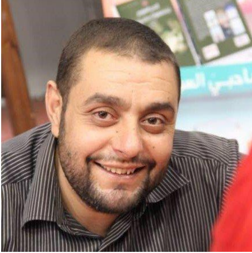
الرّوائي أيمن العتوم