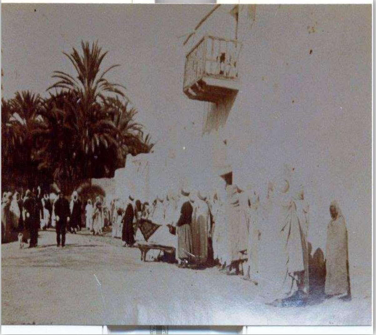
-جنازة الأمير الهاشمي-