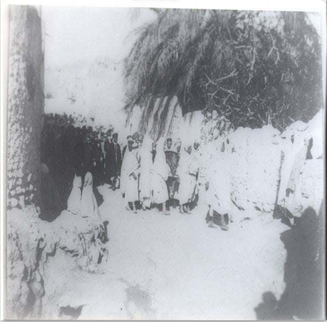
-جنازة الأمير الهاشمي-