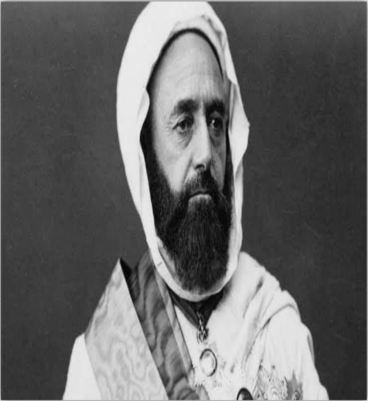
الأمير عبد القاور