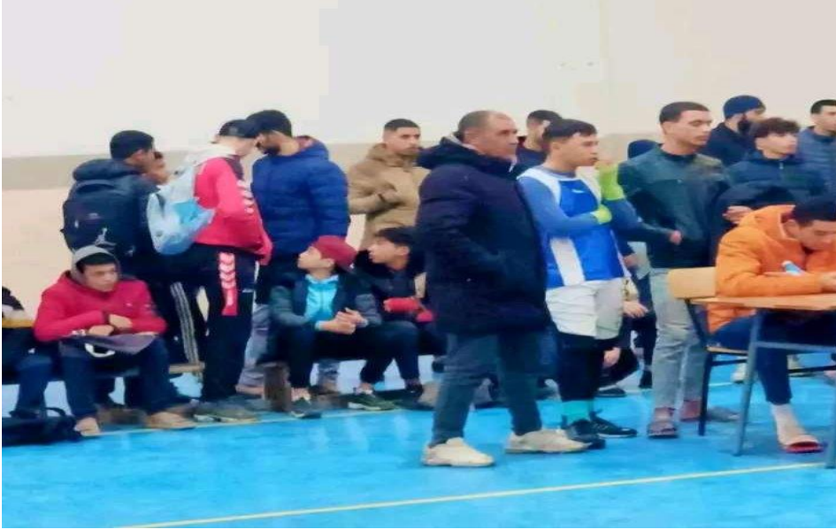
صورة تعبر عن جانب من دورة رياضية

وأضاف آخر "أنصح كل الشباب بالاشتراك واستغلال أوقات الفراغ فيما ينفع"، خاصة وأن الأسعار والاشتراك في المؤسسة تعد رمزية ولا تتجاوز : 200 دج، حيث الاستفادة من مجمل الخدمات والامتيازات التي تقدمها المؤسسة (ممارسة الرياضة، الرسم، الموسيقى، نادي المطالعة، نادي البيئة) وهذا قصد احتواء ومرافقة هذه الشريحة وذلك بجذبهم نحو هذه النشاطات ، وهو ما من شأنه أن يعزز معاني المواطنة والتعاون والتفاهم من أجل خلق الانسجام الاجتماعي.